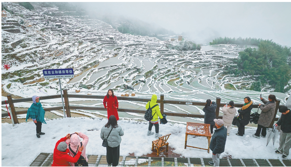
3月30日清晨，游客在云和梯田景区观赏雪景。

在千米海拔的云和梯田景区，春天的泥香混着童声笑语随风飘散。成群结队的中小学生在老师带领下，开启特色的春日研学之旅，感受畲族民俗文化和赤脚踩泥抓鸭的乐趣，在“自然