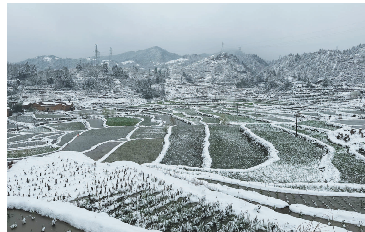
3月30日,我市莲都、缙云、龙泉等地高山地区迎来一场突如其来的降雪,皑皑白雪覆盖山巅,宛如一幅水墨丹青,为早春增添了一抹别样的诗意。图为缙云县大洋镇后村村梯田雪景。

这场春天的奔跑,终将在时间的长跑中显现出更深层的意义,每个人都能成为时代赛道上的赢家。