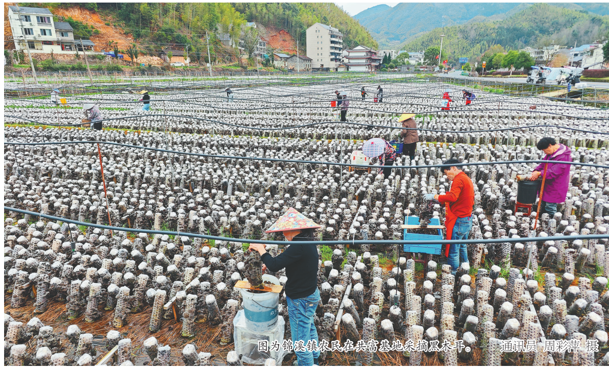
图为锦溪镇农民在共富基地采摘黑木耳。

“以前种地靠天吃饭,收入不稳定。现在把土地流转给强村公司,不仅有租金收入,还能在基地打工,一年下来能挣不少钱呢!”锦溪镇农民刘海梅笑着说。通过统筹安排,黑木耳基地的场地处理、做畦、采摘晾晒等一系列工作,为70多名村民解决了就业问题,其中包括5户低收入农户,带动村民增收