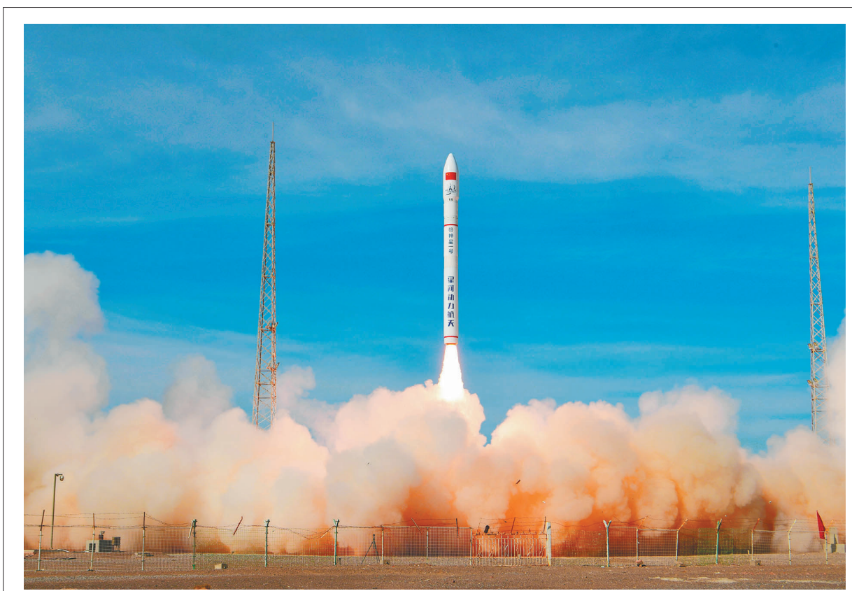
3月17日16时07分，我国在酒泉卫星发射中心使用谷神星一号运载火箭，成功将云遥一号55-60星发射升空，卫星顺利进入预定轨道，发射任务获得圆满成功。

《通知》要求，各级党委(党组)要对本地区本部门本单位学习教育负总责，党委(党组)主要负责同志要担负起第一责任人责任，紧密结合中心工作，精心组织实施，加强分类指导，做好宣传引导，坚决反对形式主义。