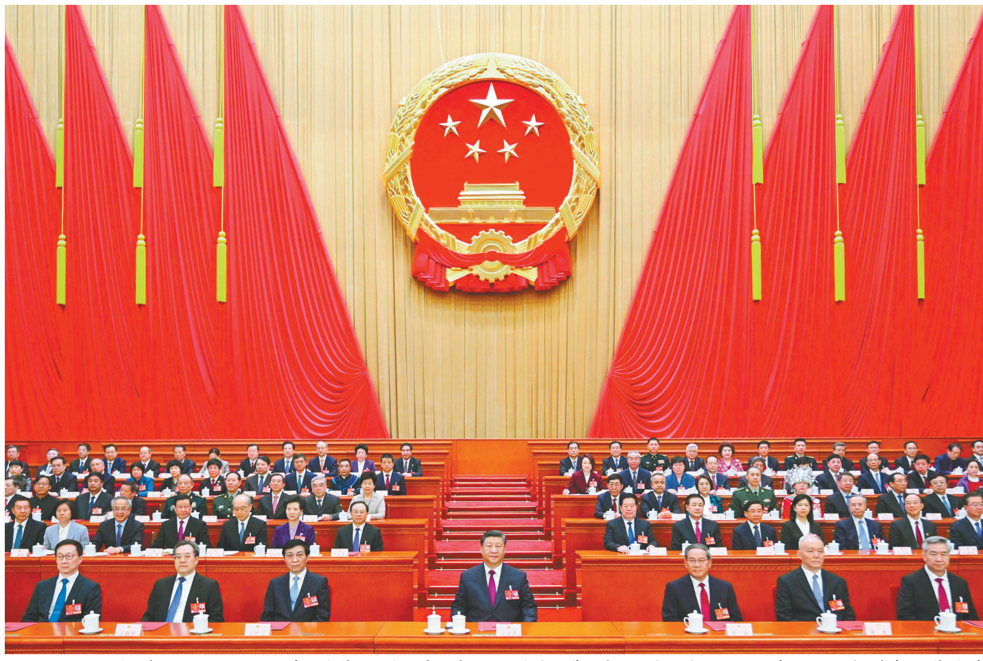
3月11日下午,十四届全国人民代表大会第三次会议在北京人民大会堂闭幕。党和国家领导人习近平、李强、王沪宁、蔡奇、丁薛祥、李希、韩正等在主席台就座。

批准政府工作报告、全国人大常委会工作报告等 通过关于修改代表法的决定 习近平签署主席令予以公布 习近平李强王沪宁蔡奇丁薛祥李希韩正等在主席台就座