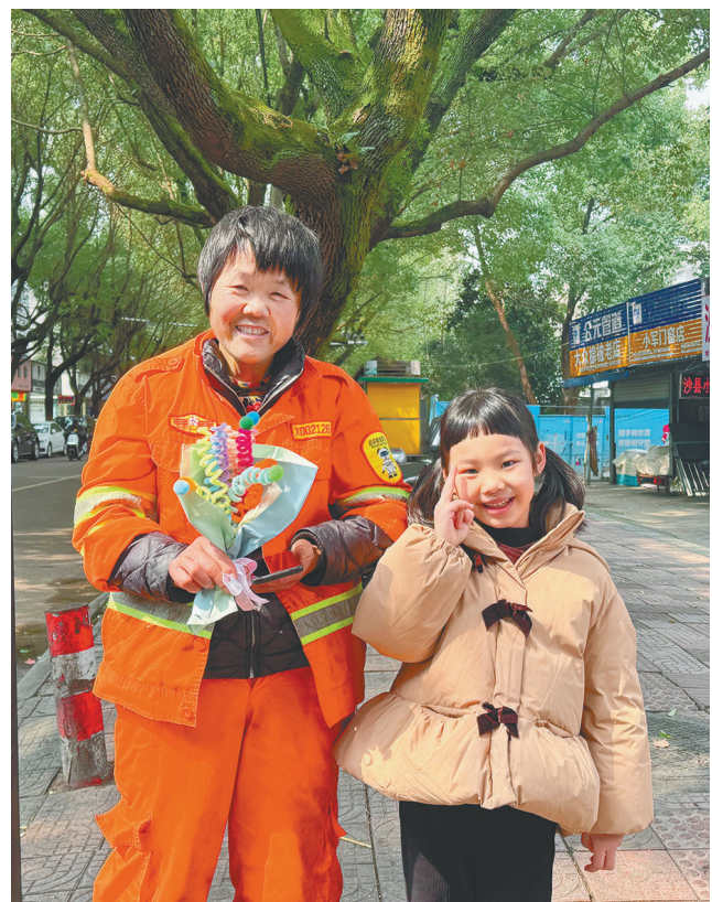
昨日,丽水市实幼集团阳光园中四班举行了一场特别的手工活动。在老师的帮助下,他们用彩纸、丝带扎出缤纷花朵,并将礼物送给辛勤工作的环卫工人和药房药师阿姨,以微小善举传递感恩之情。

步降低等痛点难点,积极赋能农业智能化建设。 下一步,相关金融机构将持续加强部门联动,持续深化遥感技术应用,探索无人机技术与遥感技术在粮农贷的结合,不断扩大“遥感粮农贷”的惠及面,进一步推动数字金融与普惠金融的深度融合,助力农业现代化发展。