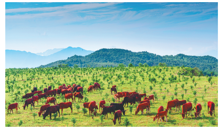
峰源生态牧场。