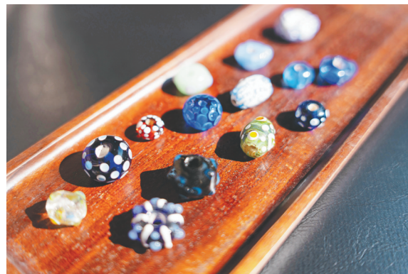
中国古代蜻蜓眼玻璃珠技法创新系列