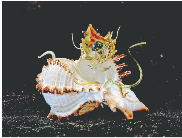
灯工玻璃、综合材料《呼喊》

在这间200多年历史的四合院里，他们一边创作，一边传承；一边创新，一边突破，“在古老的四合院，玩出年轻的非遗”。