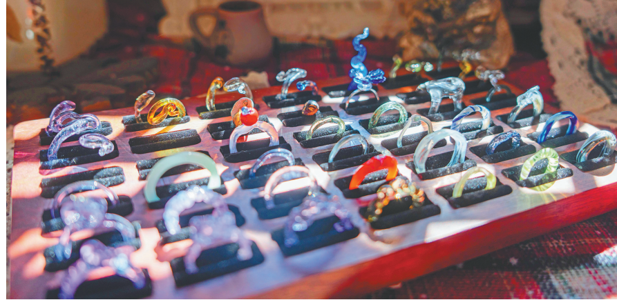
灯工玻璃饰品系列