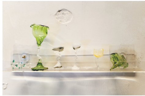
灯工玻璃吹制系列