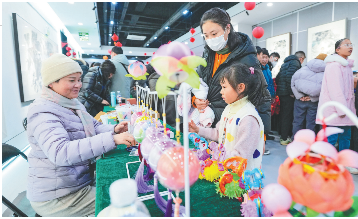
1月11日，市民们在活动中参观非遗项目展演。

全国审计工作会议暨全国审计机关先进集体和先进工作者表彰大会1月10日至11日在北京召开。会上，国务委员兼国务院秘书长吴政隆传达习近平重要指示，80个全国审计机关先进集体、45名先进工作者受到表彰。