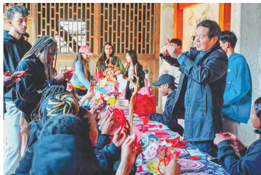
向游客展示推广花灯