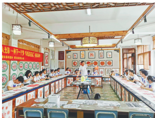
上课传授花灯制作技艺