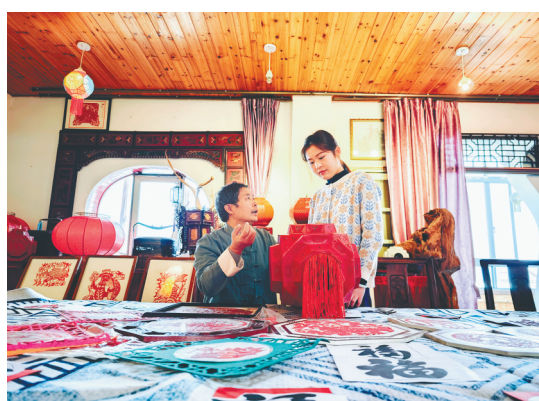
为花灯爱好者讲解