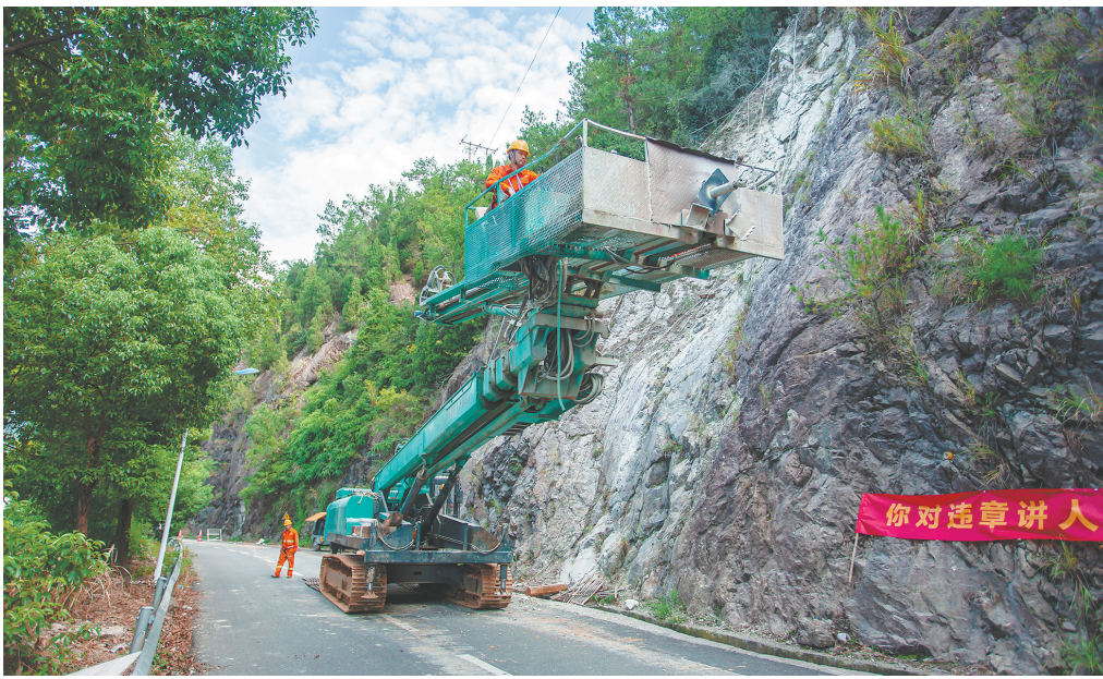
实施农村公路边坡“监测+防灾”管理

市公航运中心积极组织编制《农村公路灾毁保险效能评估办法》《农村公路灾毁保险工作手册》等,确保赔付流程公正、高效。其中《公路财产保险损失计量标准》通过中国工程建设标准化协会公路分会立项,为全国首个公路保险团体标准探索。同时,依托“一路一档”数据底座,创新推出全省首个农村公路灾毁保险数字平台,交通部门、乡镇机关、保险公司三方可通过平台开展灾毁调查、确认及审批工作,实现农村公路灾毁案件处理一网通办。一线人员通过手机端上传现场情况,指挥中心实时了解事态发展,报险流程由“至少1天”变为“即时办理”。目前平台累计办结灾毁案件170余起,办理速度提升约60%。