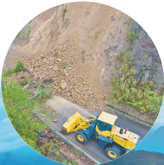
第一时间赶赴现场勘验,并开展应急抢险

2023年以来,市交通运输局高度重视、全面统筹,多次组织召开跨部门协调会议,研究解决难点堵点,确保机制顺畅运行;市公航运中心积极动员各方力量,通过广泛调研、考察学习、座谈交流等,推动各县(市、区)踊跃参与到该项工作中来。经不懈努力,该机制被列入交通强国专项试点、省深化农村公路管理养护体制改革试点、省巨灾保险试点等;相关经验做法入选交通运输部典型案例,并在全国推广。