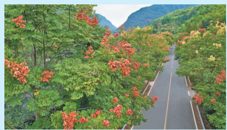
庆元县兰荒线灾毁修复前后对比照片