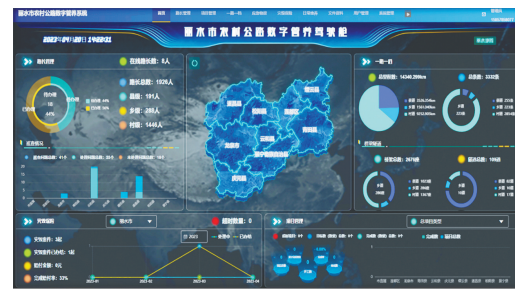
全省首个农村公路灾毁保险数字平台