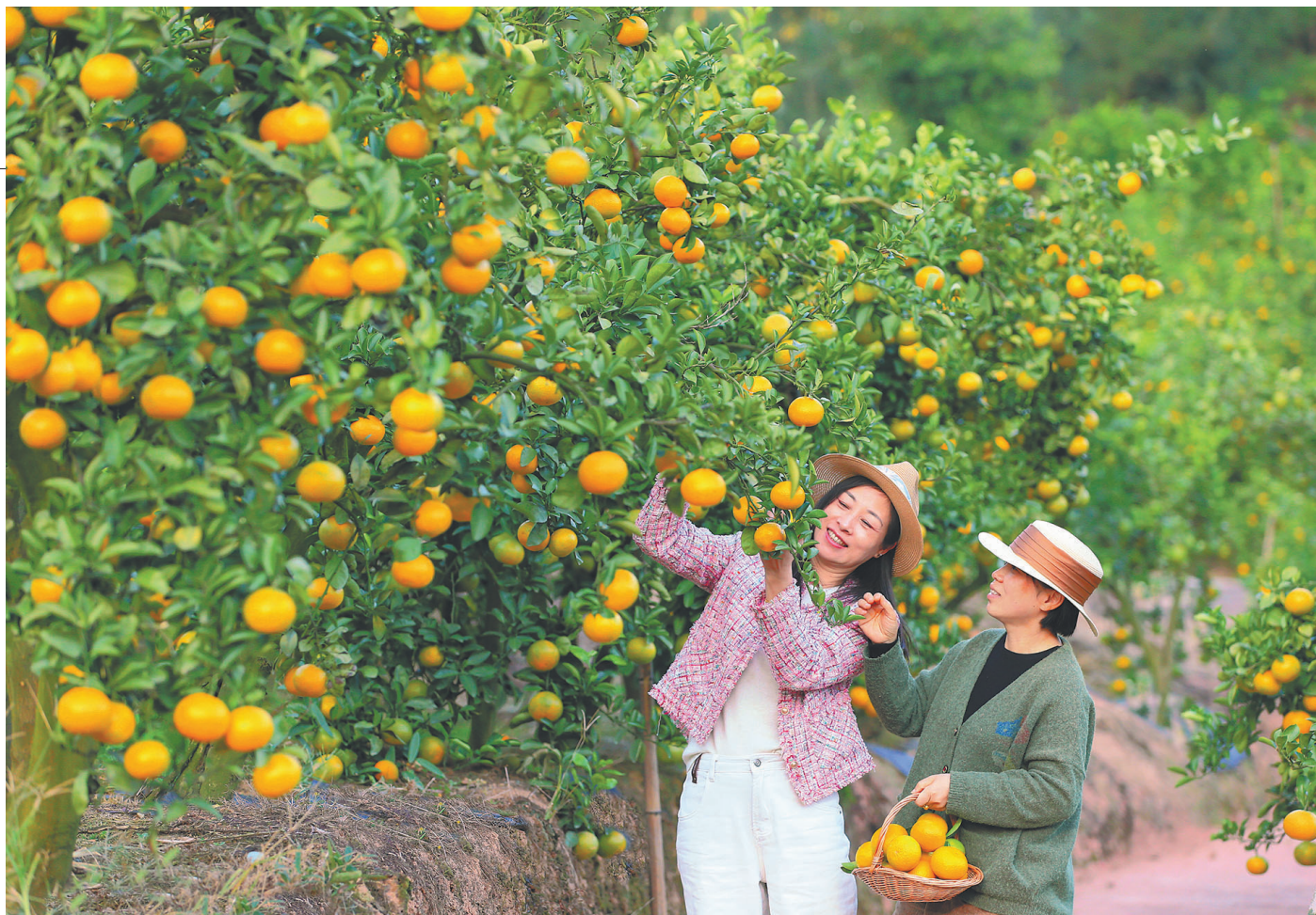
时下,云和县赤石乡张源头村甜橘柚基地的200亩甜橘柚正值采收期,游客们纷纷前来采摘。张源头村位于云和湖附近,有着独特的气候条件,非常适宜甜橘柚种植。这里生产的甜橘柚果肉柔软,味道清甜而汁水饱满,深受顾客青睐。随着农旅融合的持续深化,该基地依托云和湖景区吸引了越来越多的游客前来体验采摘的乐趣,成为当地新晋“网红”打卡地。