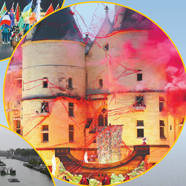
开幕式上的表演。