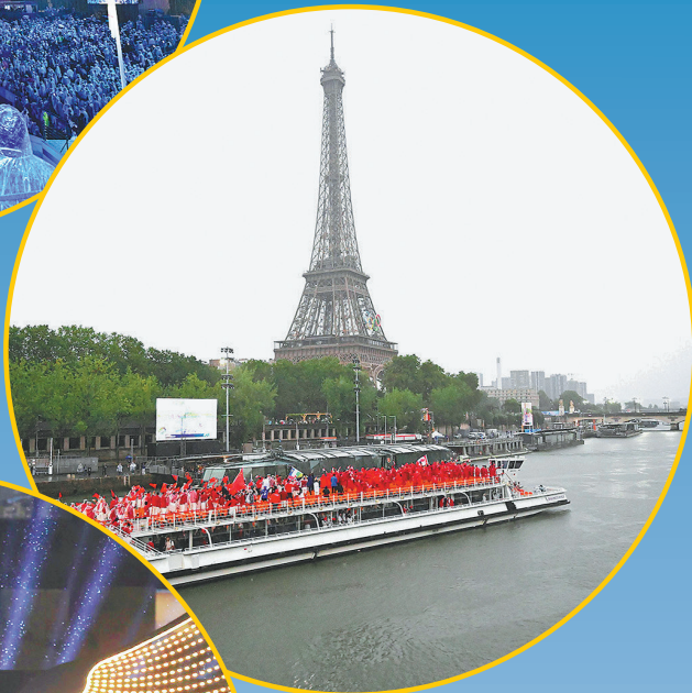
中国体育代表团乘坐的船只行驶在塞纳河上，远处是埃菲尔铁塔。