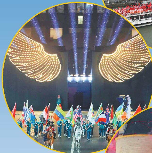
开幕式现场。