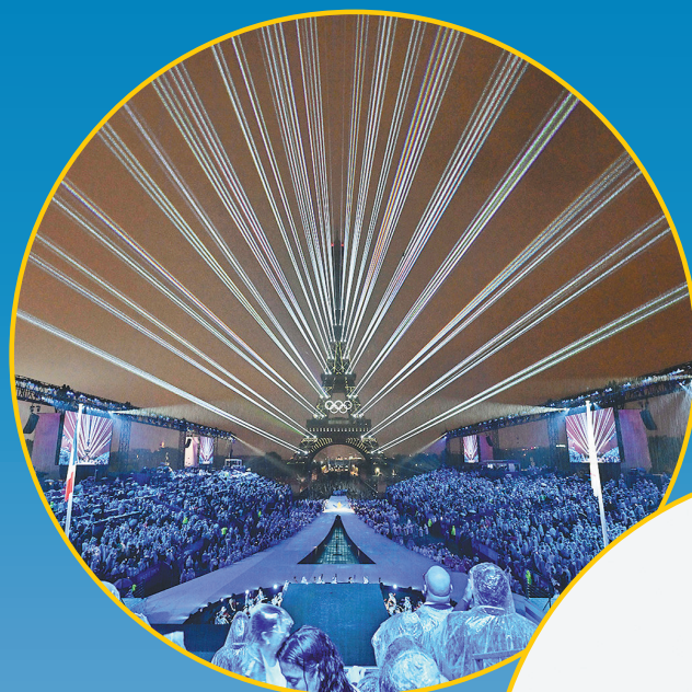
开幕式上的灯光表演。