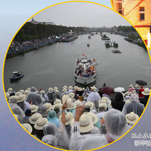
观众在现场观看开幕式。