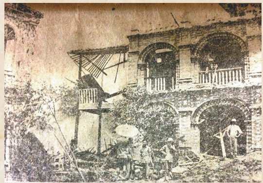
1939年8月21日，处州中学大礼堂被炸后的情景。

“原本拟收录的老新闻有近千篇，近400多页，由于版面限制，不得不删减到现在的307页。尽管有所遗憾，但仍保留了最具代表性和史料价值的新闻内容，为读者呈现丽水一段泛黄的历史。”周率介绍。