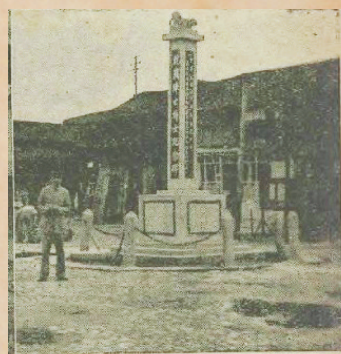
刊于1941年《展望》的丽水抗战阵亡将士纪念碑。