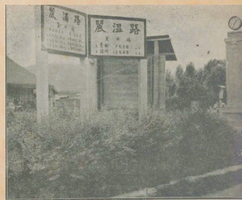
刊于1941年《展望》的丽水车站。