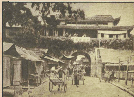
上世纪40年代的小水门。