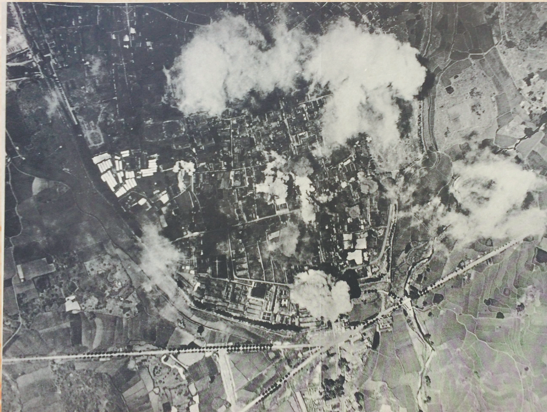
1938年5月26日，日军飞机轰炸丽水城区。