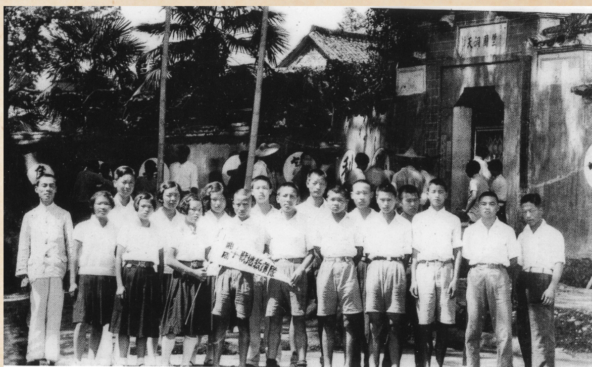
1939年，省立湘湖乡村师范学校迁松阳古市后，成立了抗日战地服务队。图为队员在广因寺总校门口合影。

在漫长的历史长河中，报纸作为近现代信息传播的主要渠道，以其即时高效的特性，成为记录时代变迁的重要载体。它不仅是社会政治、经济、文化的风向标，更是我们窥探历史变迁的宝贵窗口。《丽水老新闻(1871—1949)》一书，为我们打开了一