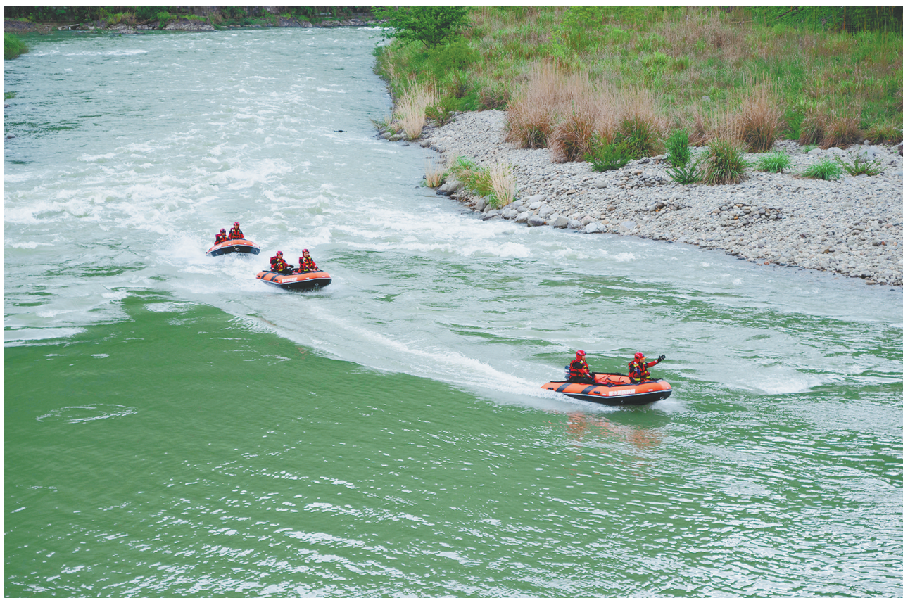
急流驾驶救援演练。

据悉,近年来,我市消防系统充分发挥景宁的区位优势和资源优势,将训练基地作为一项“金字招牌”立起来、打出去,持续借力“共富123行动”加快推进配套设施建设,提升承训、教学、保障水平,全力以赴为全省乃至全国水