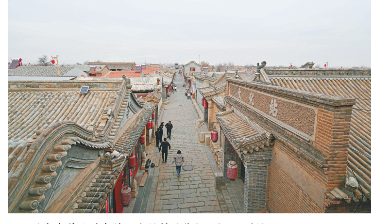
游客在蔚县暖泉镇西古堡村游览(11月26日摄)。 河北省张家口市蔚县暖泉镇西古堡村始建于明朝，当地古民居、古寺庙、古街巷、古戏楼一应俱全，还保持着明清时期的建筑风格。近年来，蔚县坚持古堡保护与开发并重，持续促进文化遗产与经济社会有机融合。