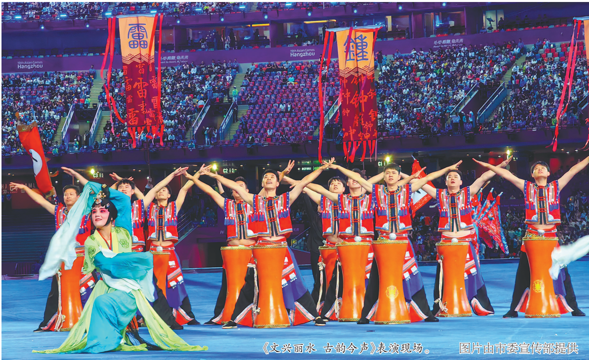
《文兴丽水 古韵今声》表演现场。

本报讯(记者 林坤伟)昨晚,在杭州亚运会开幕式仪式前表演中,由丽水推荐的特色节目《文兴丽水 古韵今声》精彩亮相,在全世界观众面前展现了丽水风采。