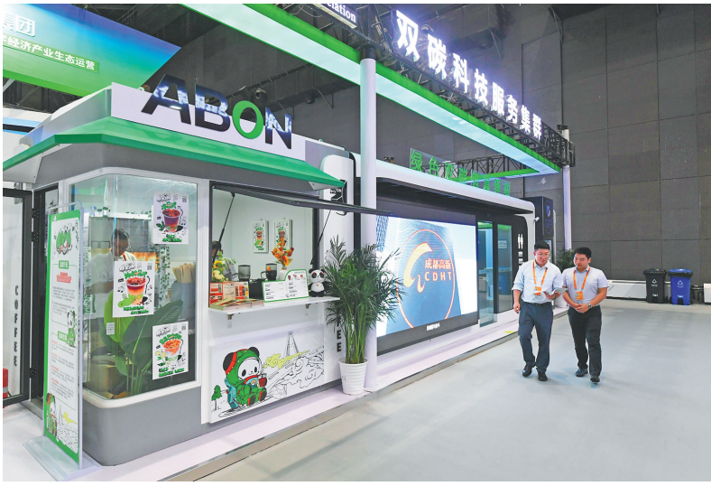
9月2日在国家体育馆拍摄的一款绿色双碳智慧驿站。

“让我们共同维护来之不易的自由贸易和多边贸易体制，共同分享全球服务贸易发展的历史机遇，为开创世界更加美好繁荣的未来共同努力。”2日上午，国家主席习近平在北京向2023年中国国际服务贸易交易会全球服务贸易峰会发表视频致辞。习近平主席把握大势、科学谋划，着眼推动全球服务贸易和服务贸易发展与合作提出中国主张，展现了中国推进高水平开放的坚定决心，为促进世界经济发展提供强大正能量。