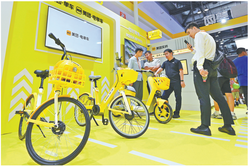
9月2日，观众在服贸会上了解共享单车、助力车和电单车等低碳出行方式。