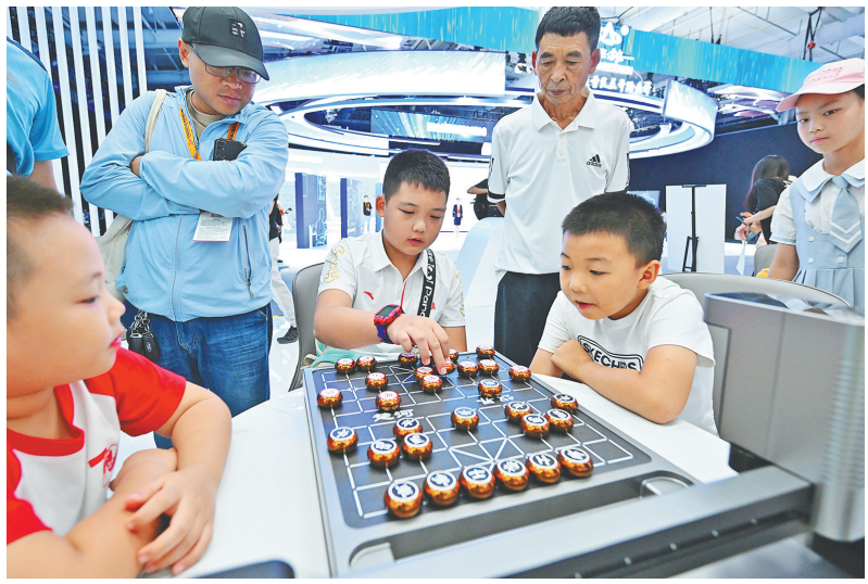
9月3日，小朋友在首钢园与一款象棋机器人对弈。