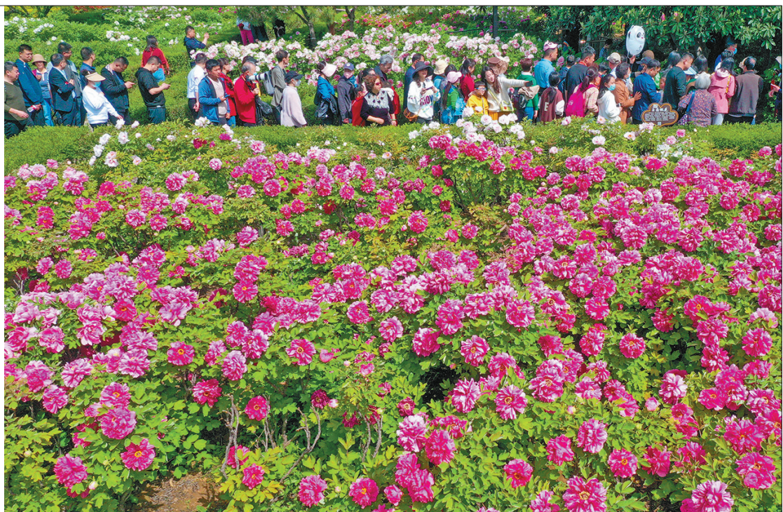
4月9日，游客在河南省洛阳市一牡丹观赏园内观赏牡丹（无人机照片）。 春和景明，人们踏青游玩，乐享春光。