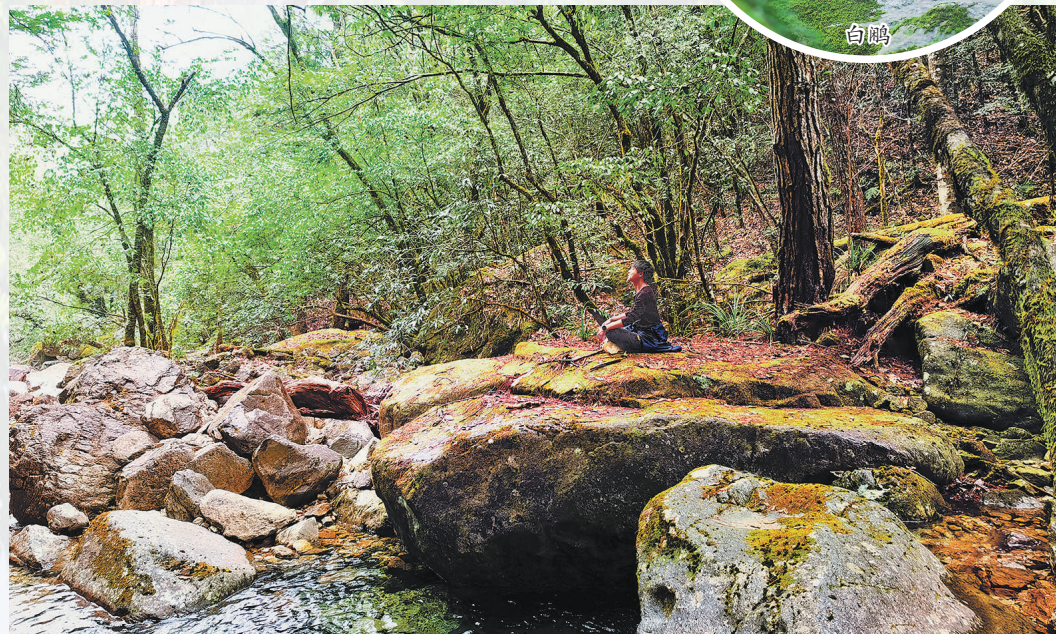
与山川为伍，听泉水叮咚。

先后在林业技术专业、动物医学专业学习，两者的结合，让门外汉变成了一个业界小有名气的后起之秀；与人聊天浑身不自在，钻进森林深处才会体会到自由自在，这种性格让他在常年的野外生活中找到真正的自我；