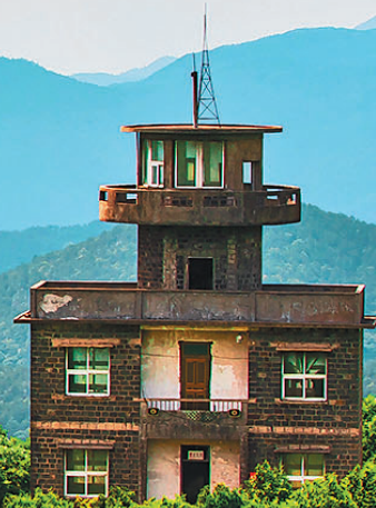
百山祖景区