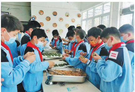
莲都区天宁小学用餐优秀的班级能得到加餐奖励