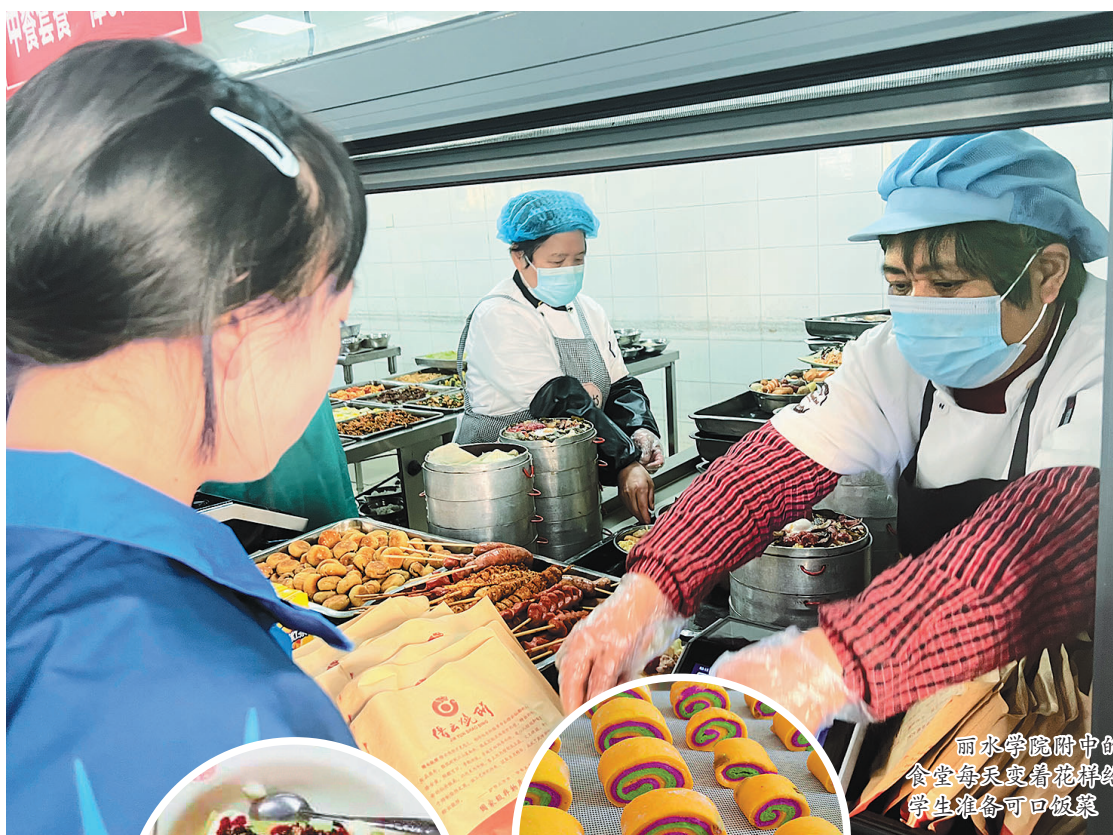
丽水学院附中的食堂每天烹制花卷给师生准备可口饭菜