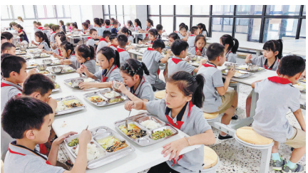
莲都区大洋路小学教育集团城西校区的学生在学校食堂开心用餐

俗话说“民以食为天”。对学生而言,紧张的学习节奏,最需能量补充,食堂就是他们的最佳“补给站”。近年来,我市各校积极为师生打造清廉、安全、健康、营养、美味的食堂,不少学校根据实际情况推出特色美食,还制定了相应的管理方法、方便举措,不断提升管理能力和服务质量,在小食堂里做足“大文章”,让师生满意,家长放心。