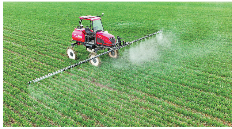
2月23日，在安徽省亳州市谯城区赵桥乡“无人农场”，一台无人驾驶自走式喷杆喷雾机对小麦喷洒防治病虫害药物（无人机照片）。眼下正值春耕备耕的农忙时节，大江南北到处是辛勤劳作、耕耘春天的“春耕图”。

习近平强调，中国共产党正在团结带领全国各族人民以中国式现代化全面推进中华民族伟大复兴。新时代新征程上，我们坚持和平发展、合作共赢。中方愿同柬方努力打造“钻石六边”合作架构，支持柬建设“工业发展走廊”和“鱼米走廊”，加快构建中柬命运共同体。中方将继续支持柬“国王工作队”开展工作，给柬埔寨民众带来更多福祉。西哈莫尼和莫尼列表示，感谢习近平主席和彭丽媛教授对我们