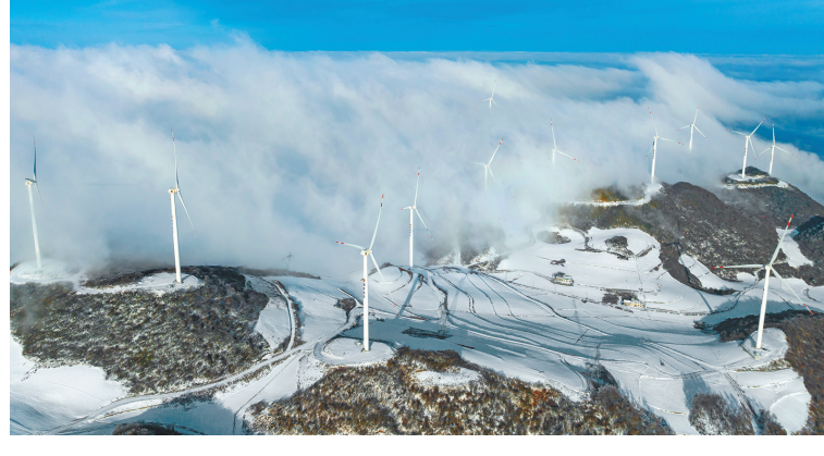
2月24日在湖北省宜昌市秭归县两河口镇云台荒村拍摄的风力发电机组（无人机照片）。一场春雪过后，湖北省宜昌市秭归县云台荒风力发电场银装素裹，风电机组在云海中共舞，美景如画。

善人道主义状况，提供快速、安全、无障碍的人道主义准入，防止出现更大规模人道主义危机。支持联合国在对冲突地区人道援助方面发挥协调作用。 六、保护平民和战俘。冲突当事方应严格遵守国际人道法，避免袭击平民和民用设施，应保护妇女、儿童等冲突受害者，尊重战俘的基本权利。中方支持俄乌交换战俘，各方应为此创造更多有利条件。 七、维护核电站安全。反对武装攻击核电站等和平核设施。呼吁各方遵守核安全公约等国际法，坚决避免出现人为核事故。支持国际原子能机构为促进和平核设施的安全安保发挥建设性作用。 八、减少战略风险。核武器用不得，核战争打不得。应反对使用或威胁使用核武器。防止核扩散，避免出现核危机。反对任何国家在任何情况下研发、使用生化武器。 九、保障粮食外运。各方应均衡全面有效执行俄罗斯、土耳其、乌克兰和联合国签署的黑海粮食运输协议，支持联合国为此发挥重要作用。中方提出的国际粮食安全合作倡议为解决全球粮食危机提供了可行方案。 十、停止单边制裁。单边制裁、极限施压不仅解决不了问题，而且会制造出新的问题。反对任何未经安理会授权的单边制裁。有关国家应停止对他国滥用单边制裁和“长臂管辖”，为乌克兰危机降温发挥积极作用，也为发展中国家发展经济和改善民生创造条件。 十一、确保产业链供应链稳定。各方应切实维护现有世界经济体系，反对把世界经济政治化、工具化、武器化。共同减缓危机外溢影响，防止国际能源、金融、粮贸、运输等合作受到干扰，损害全球经济复苏。 十二、推动战后重建。国际社会应采取措施支持冲突地区战后重建。中方愿为此提供协助并发挥建设性作用。