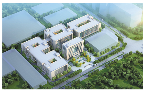
年产4000吨高纯钽铌新材料绿色制造项目(效果图)。