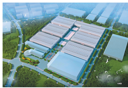
浙江景宁民族双创中心(效果图)。