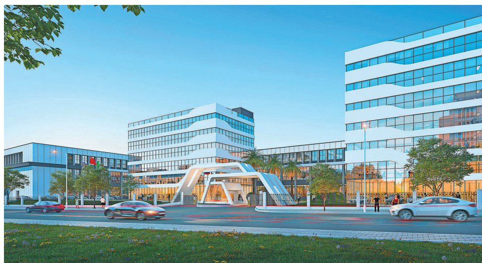
浙江景宁民族双创中心(效果图)。