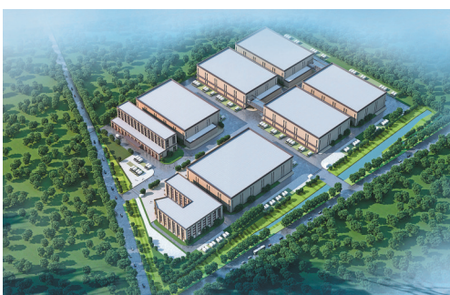
丽水格派新能源智造项目(效果图)。