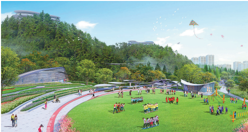
丽水南城生态停车场改造提升项目(效果图)。