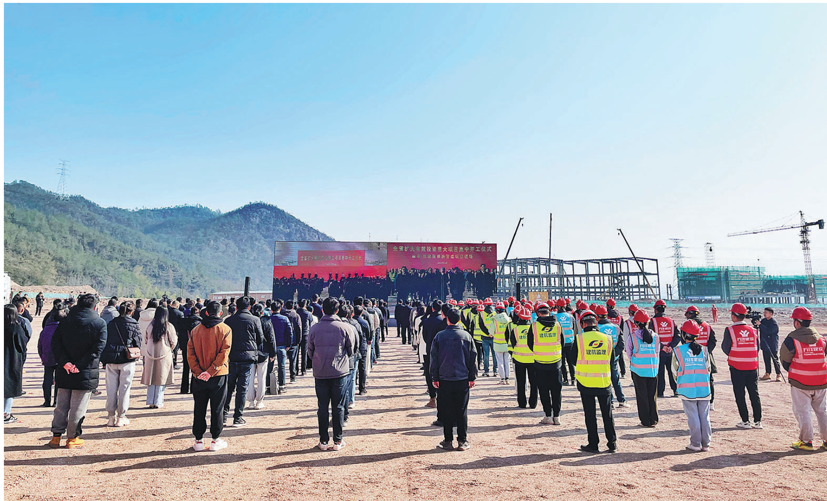
集中开工仪式现场。

“开局就是决战,起步就是冲刺”。当前,全市上下正锚定目标加油干,抢抓机遇勇前行,全力以赴拼项目赛投资,大干快上促投产比发展,以抓大发展的气魄大抓大项目,确保一季度经济开门稳、开门好,再接再厉实现全年红、全年胜。