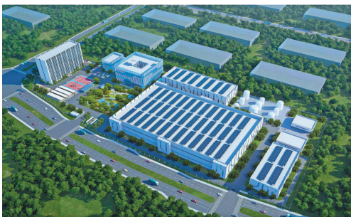
丽水水晶引超薄精密柔性薄膜封装基板生产线项目(效果图)。