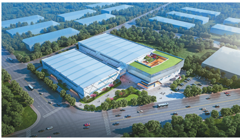
丽水新川新材料年产4000吨MLCC用纳米级镍粉生产线项目(效果图)。