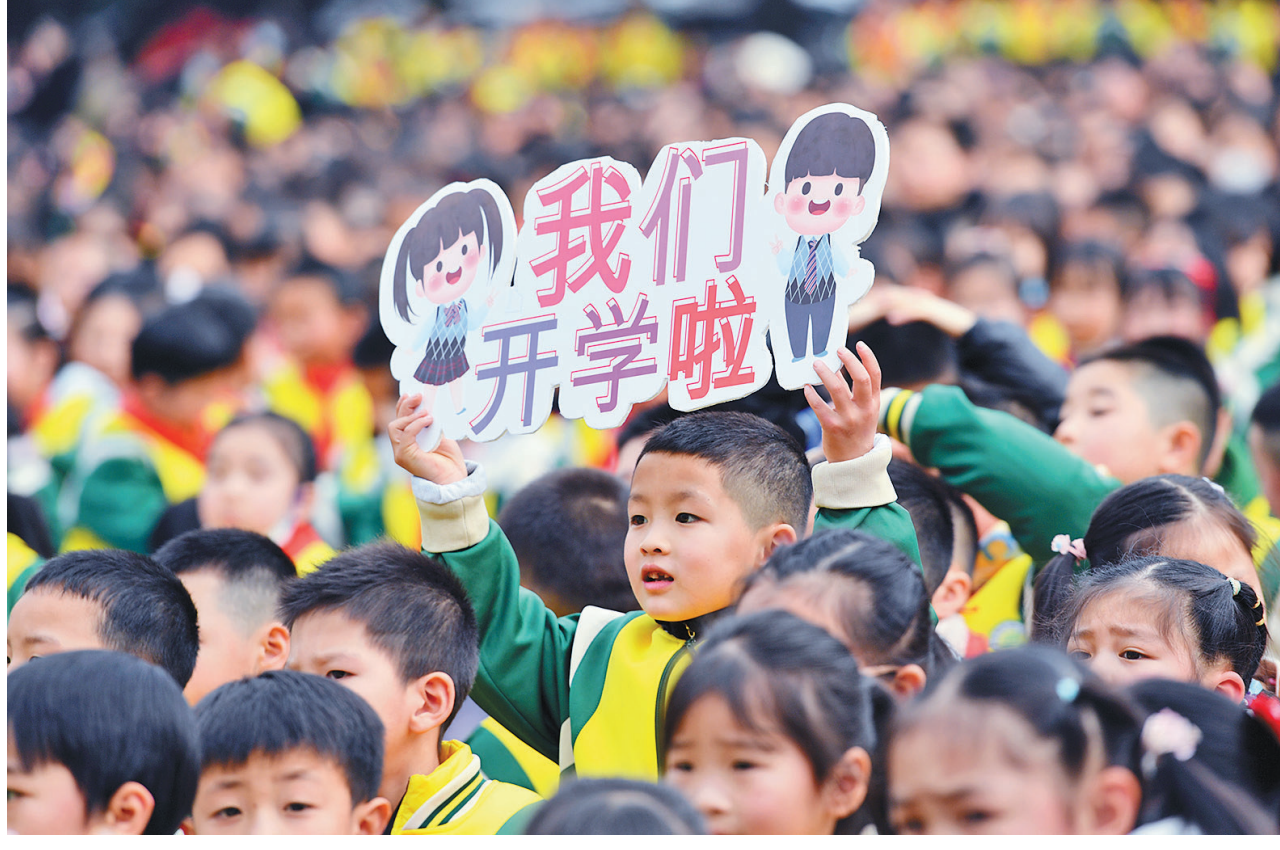
2月6日,四川省南充市蓬安县实验小学的学生举着“我们开学啦”的牌子参加开学典礼。当日,全国多地迎来2023年春季学期开学。