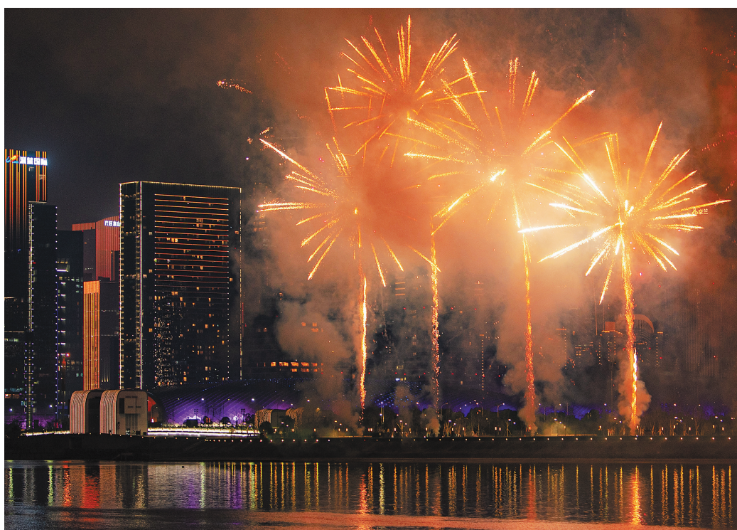
杭州烟花灯光秀 点亮元宵夜

在罗马尼亚首都布加勒斯特，“欢乐春节”中国电影日活动3日拉开帷幕，开幕式上播放了苏州非遗题材纪录片《天工苏作》。此次活动将持续至9日，《铁道英雄》《中国机长》等中国影片将登陆罗马尼亚当地院线。罗马尼亚影评人尼斯托尔说，希望当地观众通过电影日活动加深对中国的了解，希望罗中两国电影界加强交流与合作。