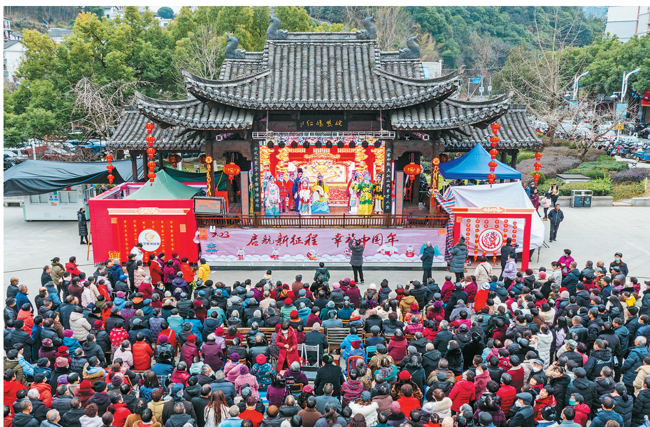
今年春节,全市各地各种活动精彩纷呈,到处洋溢着新春的气息。在遂昌县平昌广场,婺剧和越剧大戏轮番上演,市民、戏迷把整个广场围得水泄不通。 记者 程昌福 特约摄影记者 章建辉 摄