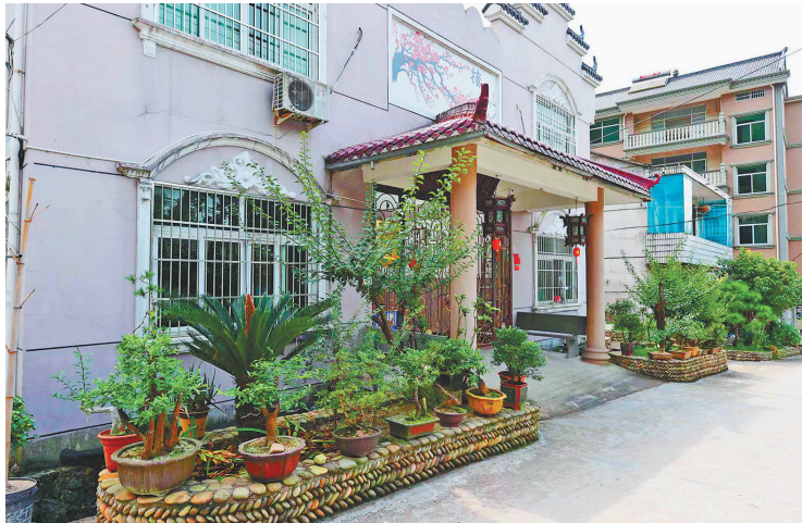
村民房前屋后种植的各式盆景