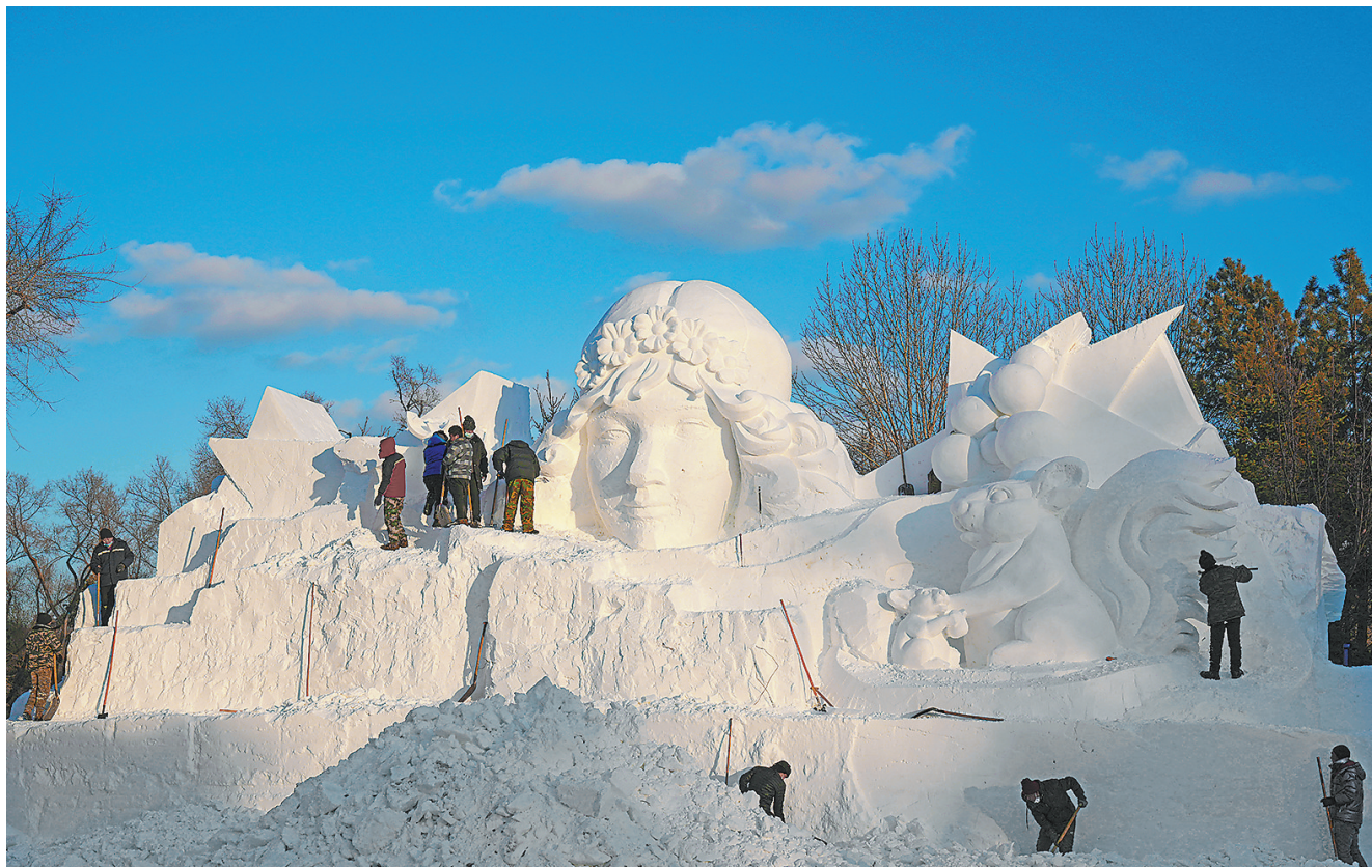
12月9日，雪雕师在哈尔滨太阳岛雪博会园区进行雪雕创作。 目前，哈尔滨市第35届太阳岛雪博会的景观雪雕创作正有序进行。本届太阳岛雪博会以“冰雪之都 梦雪奇缘”为主题，以雪雕艺术为载体，将带给游客艺术观赏、博览活动及游乐参与的融合体验。