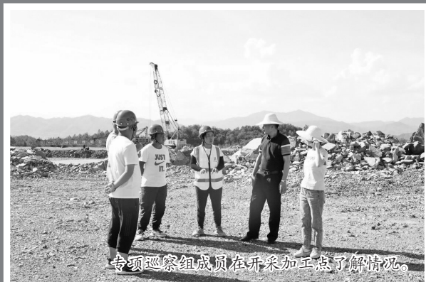
专项巡察组成员在开采加工点了解情况。