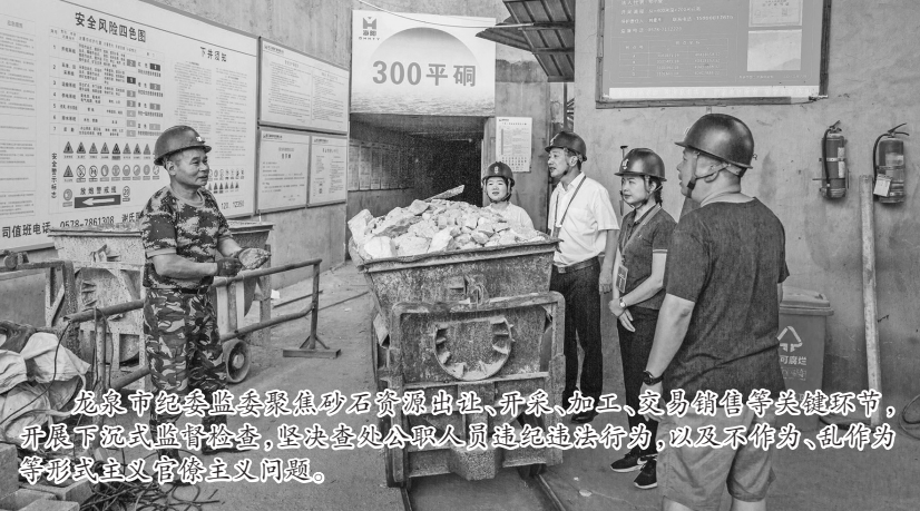
龙泉市纪委监委聚焦砂石资源出采、开采、加工、交易销售等关键环节,开展下沉式监督检查,坚决查处公职人员违纪违法问题,以及不作为、乱作为等形式主义官僚主义问题。