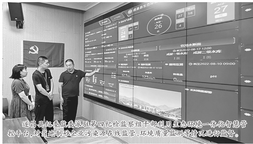
遂昌县纪委监委派驻第四纪检监察组干部利用生态环境一体化智慧管控平台,对当地制砂企业污染源在线监管、环境质量监测等情况进行监督。