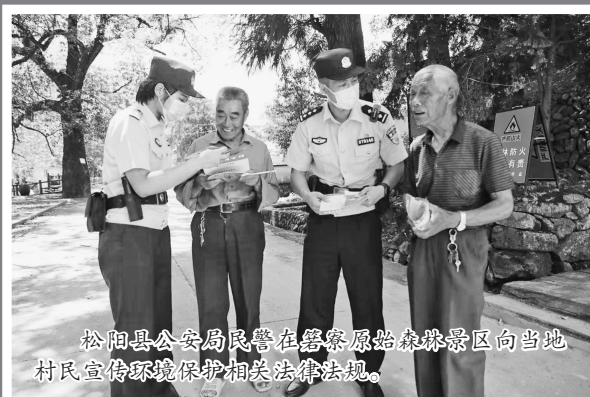
松阳县公安局民警在松寮原始森林景区向当地村民宣传环境保护相关法律法规。