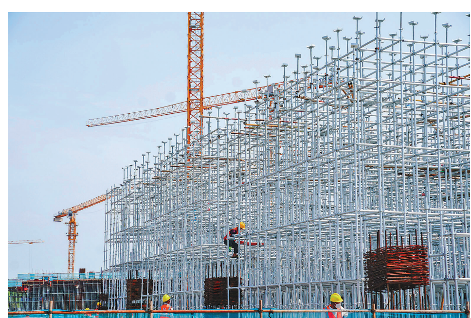
中建三局华东公司上海分公司的工人在位于上海的华为青浦研发中心项目工地上作业。