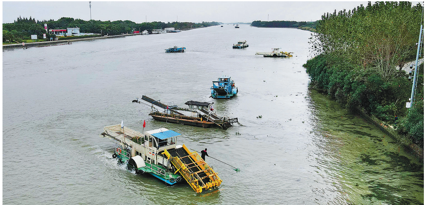
苏浙沪三地的保洁船在太浦河水域联合清理水面浮游植物。

“以党的二十大精神为指引,紧扣‘一体化’和‘高质量’两个关键词,三省一市将齐心协力,推动长三角一体化发展不断迈上新台阶。”(本版稿件均据新华社)