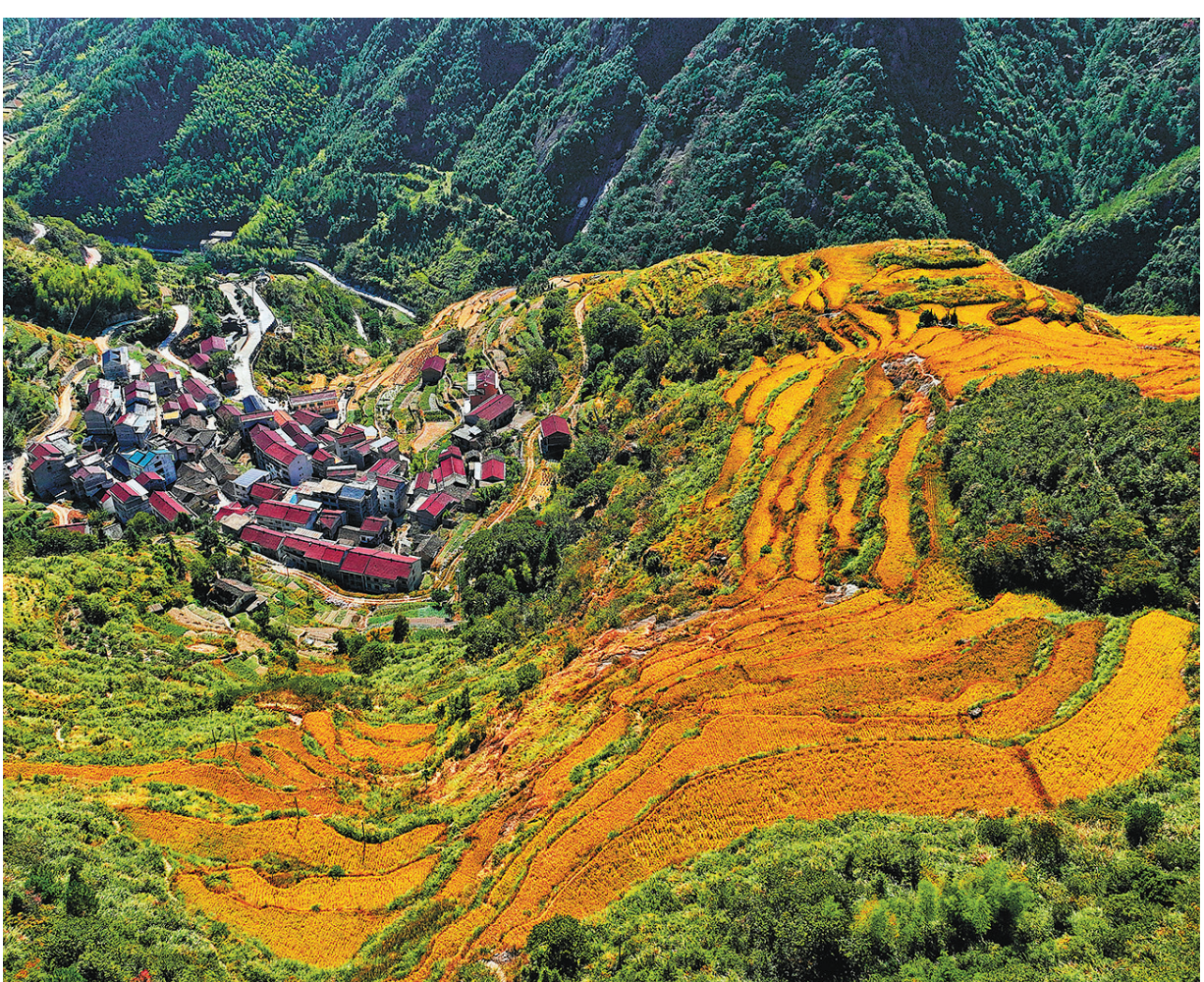
近日,青田县季宅乡下庄村股份经济合作社的300余亩水稻已经成熟,准备开镰收割。下庄村创新“党支部+股份经济合作社+村民”的合作模式,开荒种稻300余亩,种植的甬优17号水稻已连续两年获得省好米金奖。