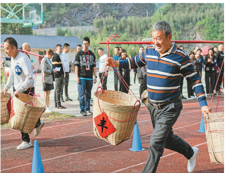
10月30日上午,莲都区黄村乡人民政府联合黄村乡乡贤联谊会举办农民运动会。本次活动由黄村乡11个村及乡贤组成12支代表队参加。比赛项目设置将竞技体育与农业活动相结合,接地气、趣味强,让村民们尽情体验运动带来的乐趣。 记者 叶江 通讯员 汤晨怡 摄

本报讯(记者 曾翠 徐丽雅 通讯员 黄芳霞 雷欣悦)“走,一起去看看什么情况。”一本笔记本,一张圆桌,一群人,日前,一场“圆桌夜话”在景宁景南乡开启。 “圆桌夜话”是今年景南乡创新开展的工作方式,针对村民白天外出务工,晚上在家的实际情况,乡干部聚焦群众需求,通过夜谈、夜访、夜调,与群众聊政策、谈发展,为他们解难题、送技术,让基层治理更有“聊效”。 “白天我去地里看过了,这是枯萎病,从幼苗到生长后期都有可能得的,采收的时候发病更厉害……”针对村民提出的庄稼枯萎不知如何防治的问题,一落座,乡里请来的渔际村水果玉米种植大户徐锋就直奔主题。接下来的一小时里,乡干部、徐锋一起手把手给村民讲解防治方法,传授科学种植技术,还帮他们研究怎么打开销路…… 为了推动乡村振兴,乡、村干部在“圆桌夜话”机制下开设“夜讲课堂”,宣传《景南乡“景宁600”产业发展扶持政策》,提供精准技术培训,增强产销融合理念,为群众“充电”。同时,乡、村干部与村民建立“一对一”联系网络,制定“一户一策”带动群众致富,并与低收入农户“结对亲”。根据每户具体情况帮扶帮困,给有种养能力的低收入户赠送鸡苗、鸭苗、树苗等,鼓励其发展种养产业促增收。针对有就业需求和能力的低收入农户,引导村内外务工和从事公益性岗位、村内保洁等工作向样本户倾斜,让他们在家门口就业增收。 “夜话”输出了致富“良液”。今年以来,景南乡开展了高山茄子、水果玉米、冷水茭白等一系列高山果蔬种植技术培训,农民的脑瓜子富起来了,农产品的品质好起来了,钱袋子也鼓了起来。 “圆桌夜话”有效解决了干群沟通有“时差”的难题,大小事都能快速反馈并落实;“石立村的路灯坏了4盏,要及时找民工来修理,要不然大家出行都不方便了。”“我家的房屋多年没修缮,雨期可能会产生安全隐患,乡政府能不能帮我想想办法?”……群众点题,政府破题。今年以来,景南乡共计开展夜谈会20余次,服务群众50余名,群众满意度大幅提高。 “双眼向下”看问题,“双脚丈量”察民情。“圆桌夜话”机制下的每周“夜调”,用多方参与治理的方式,化解了一个又一个矛盾纠纷。 今年7月,缪程村的几位村民因稻穗被羊偷吃的问题产生纠纷矛盾。景南乡第一时间召集相关人员开展“圆桌夜调”。话说了,问题解决透了,心结也就解了,红手印按下后,纠纷双方握手言和。 除了化解已经存在的矛盾纠纷,“夜调”还关注矛盾风险防患于未然。乡里以邻里矛盾纠纷、土地承包纠纷、雇工劳资矛盾以及山林矛盾等为排摸重点,通过摸底调查、个别交谈、结果分析等,做好排查登记,最大限度把隐患问题化解在村内、解决在萌芽。 景南乡是高海拔山区乡镇,外出务工人员较多。为此,乡里专门设置了“共享调解室”,将调解工作由线下搬进线上。在共享调解室内,矛盾双方在调解员邀请下进行视频调解,调解服务更加高效、快捷。 在夜讲、夜访、夜调中,“圆桌夜话”架起了干群“连心桥”,打通了基层治理“最后一公里”。