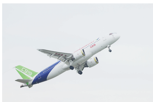
这是在陕西省蒲城县拍摄的C919大飞机的试飞机。