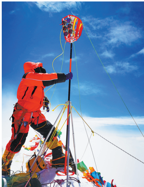
2020珠峰高程测量登山队员在珠穆朗玛峰峰顶开展测量工作。