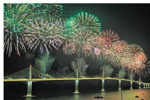
这是在克罗地亚科马尔纳纳拍摄的由中企承建的佩列沙茨大桥通车仪式上的焰火表演。

2022年7月，地处欧洲东南部的克罗地亚，一座长2440米、宽22.5米的公路斜拉桥佩列沙茨大桥通车，克罗地亚总理普连科维奇称赞这座桥“实现了将克罗地亚南北领土连为一体的夙愿”。