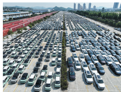
这是中铁南宁局集团有限公司柳州货运中心的新能源汽车停放场。

今年，一款新的动力电池在中国问世，能量密度达到255瓦时/千克，可实现整车1000公里续航。