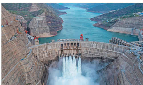
这是白鹤滩水电站。

金沙江上，白鹤滩水电站，一座拱形大坝横亘在高耸的山谷间，承受1650万吨的最大水推力。