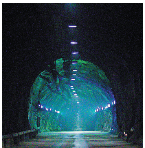
这是位于四川凉山彝族自治州的锦屏山隧道。中国锦屏山地下实验室便在这隧道中部，上方是巍巍锦屏山。