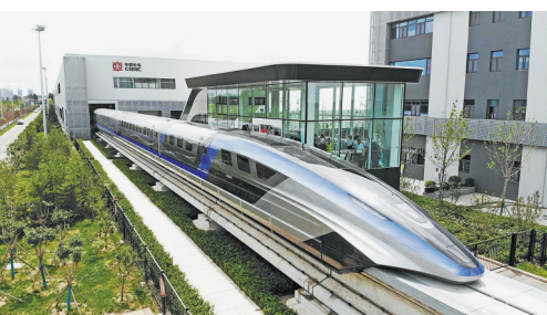
这是在山东青岛拍摄的时速600公里高速磁浮交通系统。