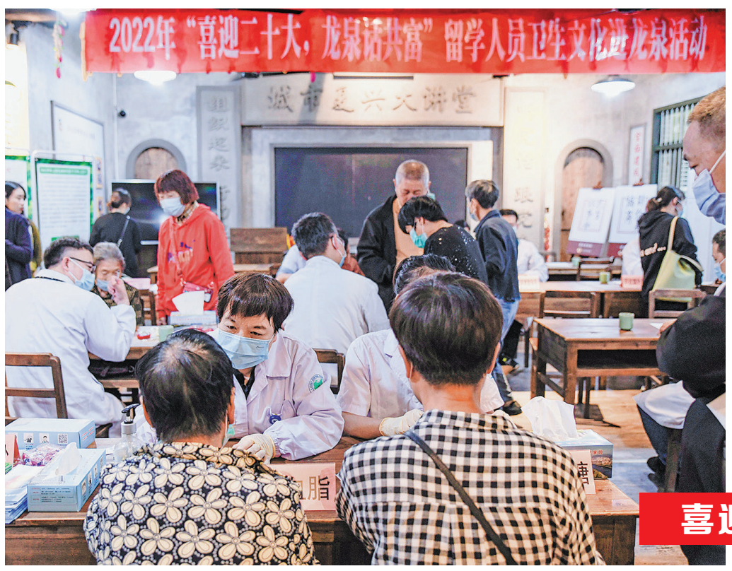
日前,丽水市留联会与龙泉市委统战部、市侨联、西街街道联合举办2022年“喜迎二十大,龙泉话共富”留学人员卫生文化走进龙泉活动。

孩子们也能在这里探寻植物“秘密”:观察植物、体验植物扦插,买回家记录植物生长。产学研用一体提高了多肉等植物的产品附加值。在省农科院结对帮扶和技术支持下,基地拥有了掐头嫁接、移动苗床、微喷滴灌等现代农业技术。通过与省农科院食品研究所的深入合作,多肉种植延伸到食品试验中,基地成功研发了食用多肉、多肉蛋糕等网红食品,开启了基地未来多肉产业开发的重要方向。多肉变产业后,借着景宁推进全域旅游发展的契机,基地所在的深洋村成功打造出多肉肉寨、桐庐莪山、平阳石城等网红打卡点,成了“网红打卡村”,年游客量超过10万人次,年产值450万元,带动群众户均每年增收2万余元。