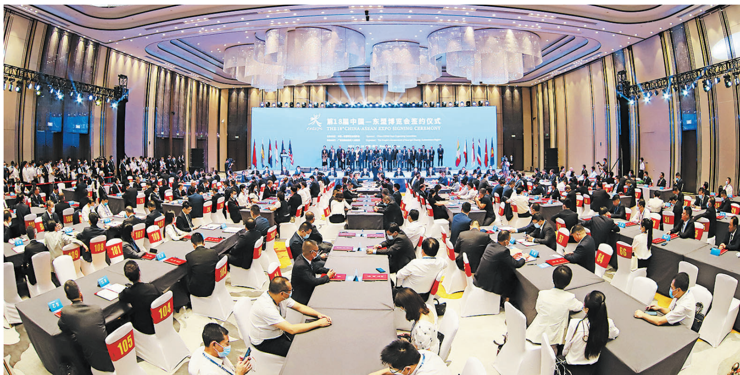
这是第18届中国—东盟博览会项目集中签约仪式现场。

1600多家企业线下参展、80多场投资贸易促进活动、20多个高层论坛……9月16日，为期4天的第19届中国—东盟博览会和中国—东盟商务与投资峰会在广西南宁开幕。