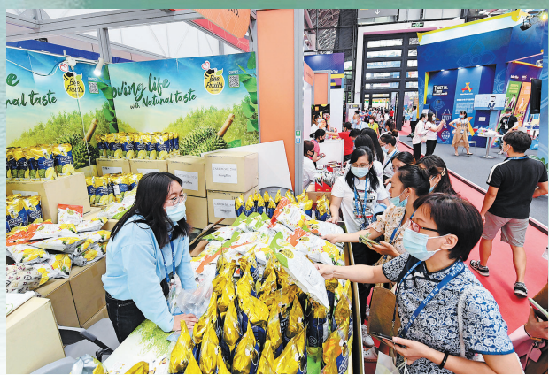
在广西南宁国际会展中心，参观者在选购商品。