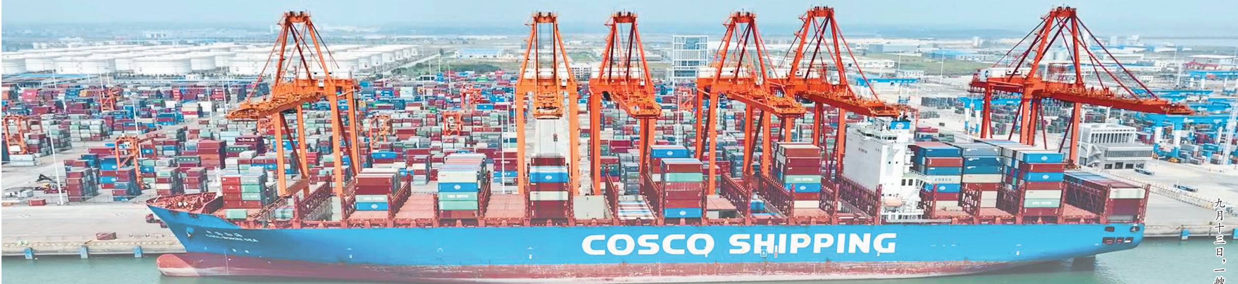
九月十三日，一艘海轮停靠在广西钦州港码头装卸货物。