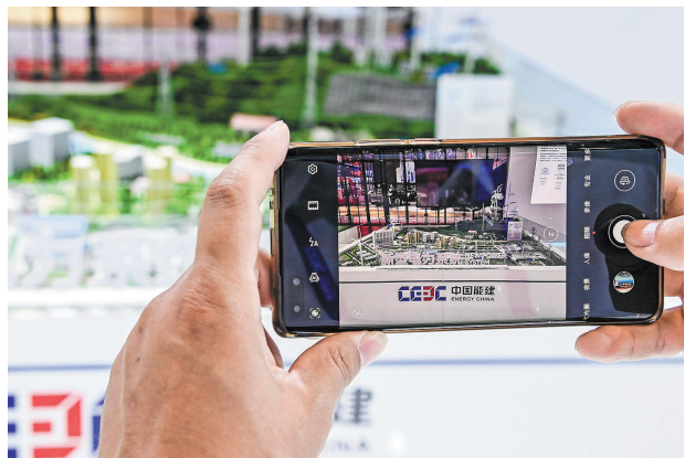
9月17日，参观者在东博会拍摄新型电力系统模型。