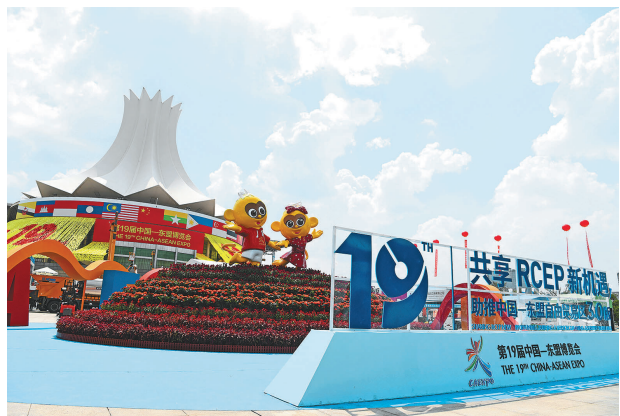
这是9月17日拍摄的南宁国际会展中心。