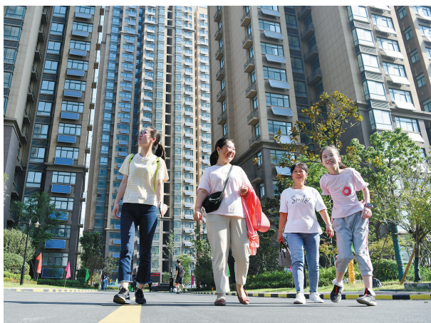
安徽省合肥市包河区同安街道甘棠苑小区回迁居民在小区内散步(2020年9月5日摄)。