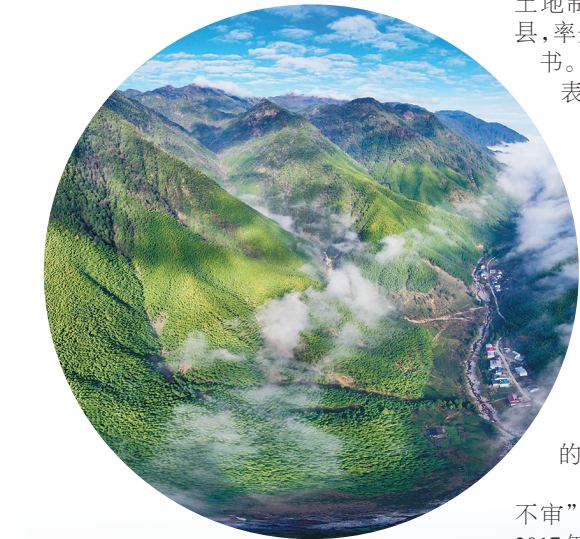
武夷山国家公园武夷裂带峡谷内云雾缭绕，村庄若隐若现(2020年12月1日摄，无人机照片)。