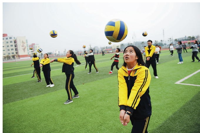
贵州省黔东南苗族侗族自治州榕江县第四中学学生在上体育课(2018年12月13日摄)。