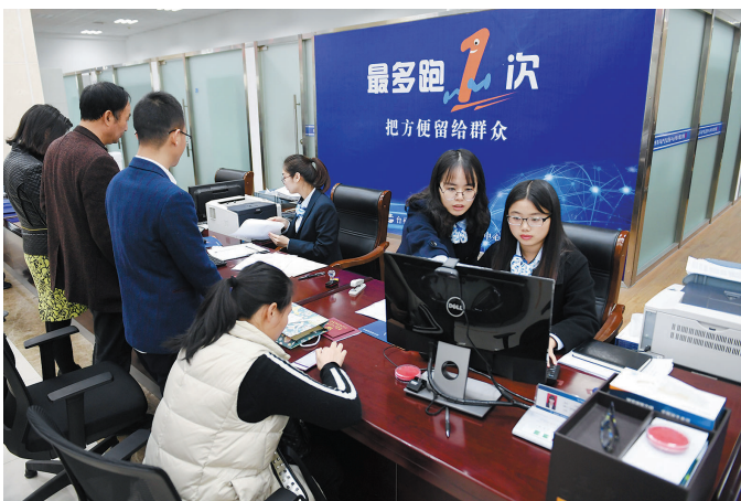
浙江省台州市行政服务中心的工作人员在给市民办理业务(2018年3月28日摄)。

“新时代坚持和发展中国特色社会主义，根本动力仍然是全面深化改革。” 党的十八大以来，以习近平同志为核心的党中央不断推动全面深化改革向广度和深度进军，中国特色社会主义制度更加成熟更加定型，国家治理体系和治理能力现代化水平不断提高，党和国家事业焕发出新的生机活力。