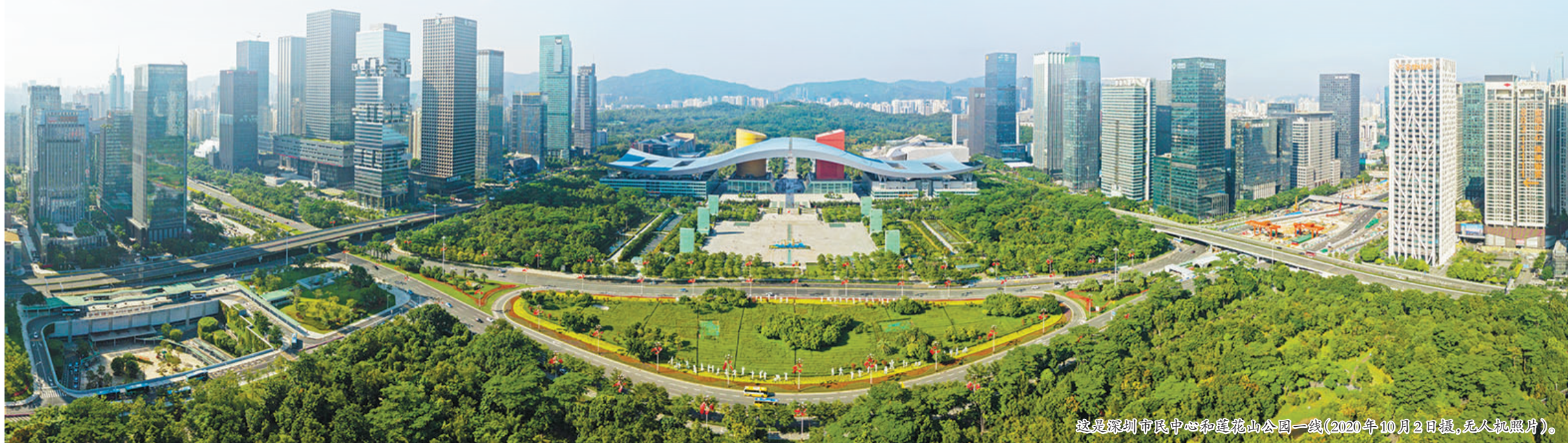
这是深圳市民中心和莲花山公园一线(2020年10月2日摄，无人机照片)。