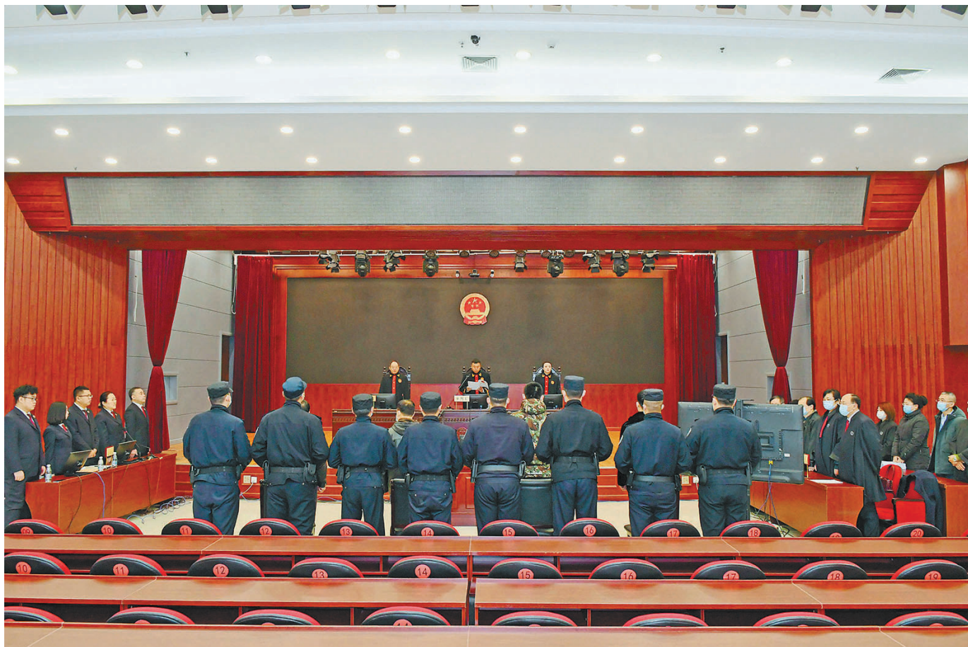
2020年11月20日，黑龙江省22家法院对38件黑恶势力和“保护伞”案件集中宣判。这是在牡丹江市中级人民法院拍摄的宣判现场。