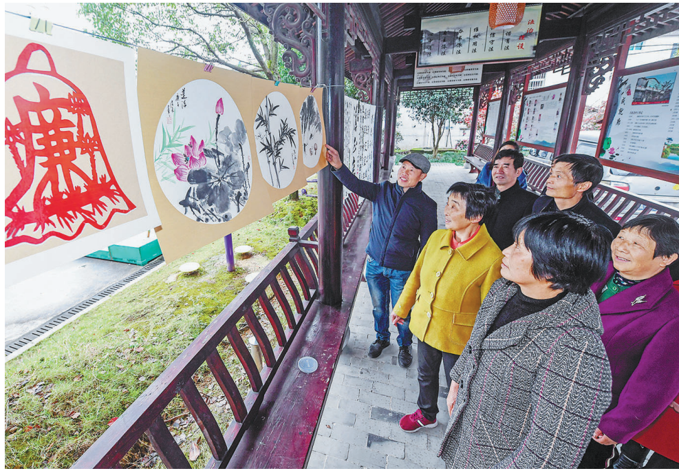
2020年11月27日，浙江省杭州市临安区龙岗镇新溪新村村民在观看以清廉文化为主题的书画展。

2017年10月27日，党的十九大闭幕后第3天，习近平总书记主持召开十九届中央政治局第一次会议，审议通过《中共中央政治局贯彻落实中央八项规定实施细则》，对贯彻执行中央八项规定、推进作风建设作