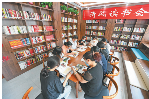
2020年6月23日，河北省枣强县纪委监委组织部分单位党员干部，在县文化广电和旅游局举行“清风读书会”。

党的十八大以来，以习近平同志为核心的党中央从制定执行中央八项规定切入整饬作风，以雷霆万钧之势推进反腐败斗争，激荡清风正气、凝聚党心民心，为党和国家各项事业发展提供了坚强保障。