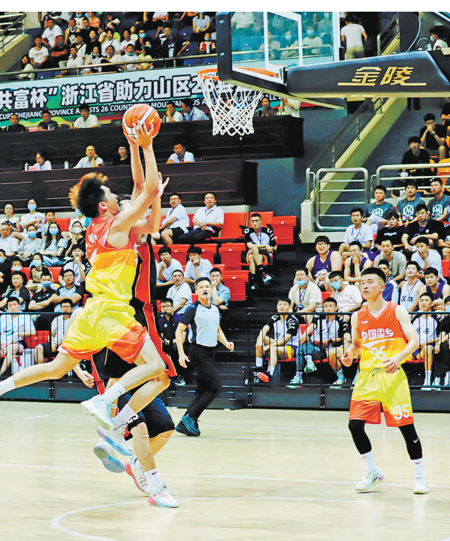
近日,省体育局主办的“建行·共富杯”浙江省助力山区26县篮球联赛在景宁开幕。联赛为期7天,以“喜迎二十大 共富创未来”为主题,26个队伍分为景宁、开化两个赛区进行,景宁赛区有13支队伍近200名球员参赛。