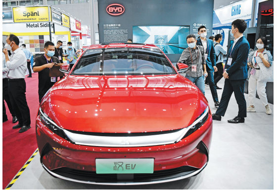
这是在第130届广交会上拍摄的比亚迪新能源汽车。