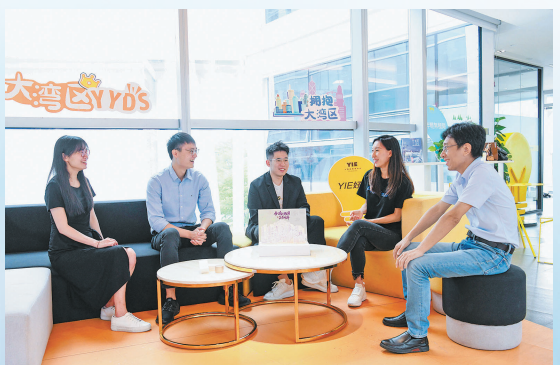
在位于深圳市的前海深港青年梦工厂，香港创业青年们一起交流各自的创业项目。

党的十八大以来，习近平总书记三次到广东考察，两次在全国两会期间参加广东代表团审议，作出系列重要指示，要求广东以更大魄力、在更高起点上推进改革开放，努力在全面建设社会主义现代化国家新征程中走在全国前列、创造新的辉煌。牢记殷殷嘱托，广东砥砺前行，在实现新使命新任务上担当新作为、干出新气象。