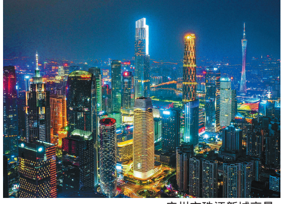
广州市珠江新城夜景。