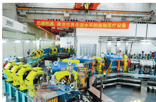
这是上海交通大学附属瑞金医院肿瘤质子中心内的质子同步加速器区。