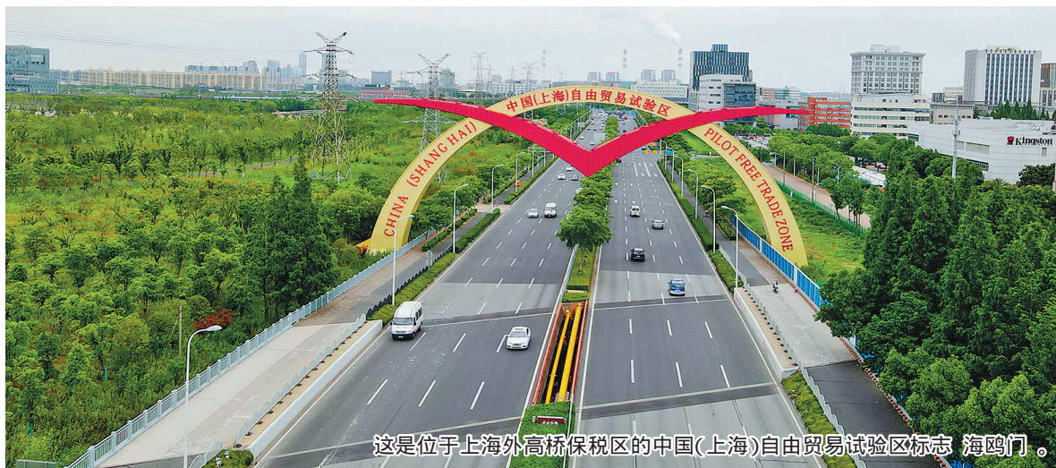
这是位于上海外高桥保税区的中国(上海)自由贸易试验区标志“海之门”。