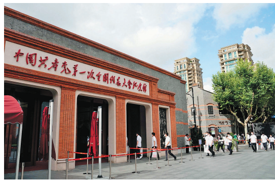
人们走进中共一大纪念馆参观。