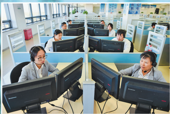
在位于北京经济技术开发区的12345市民服务热线大厅，工作人员接听热线电话（2019年11月13日摄）。