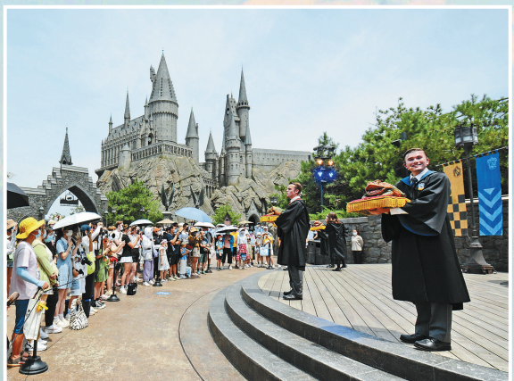
游客在北京环球影城主题公园内观看表演（2022年6月25日摄）。

下决心主动做“减法”，成为全国第一个减量发展的超大城市；坚定信心努力做“增量”，高质量发展迈出坚实步伐。