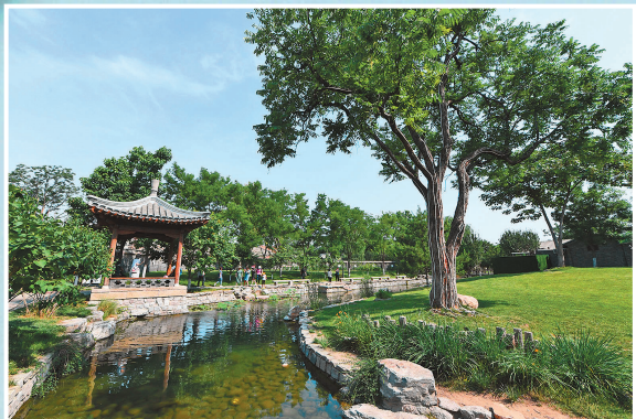
市民在北京市东城区三里河参观游览（2020年6月7日摄）。