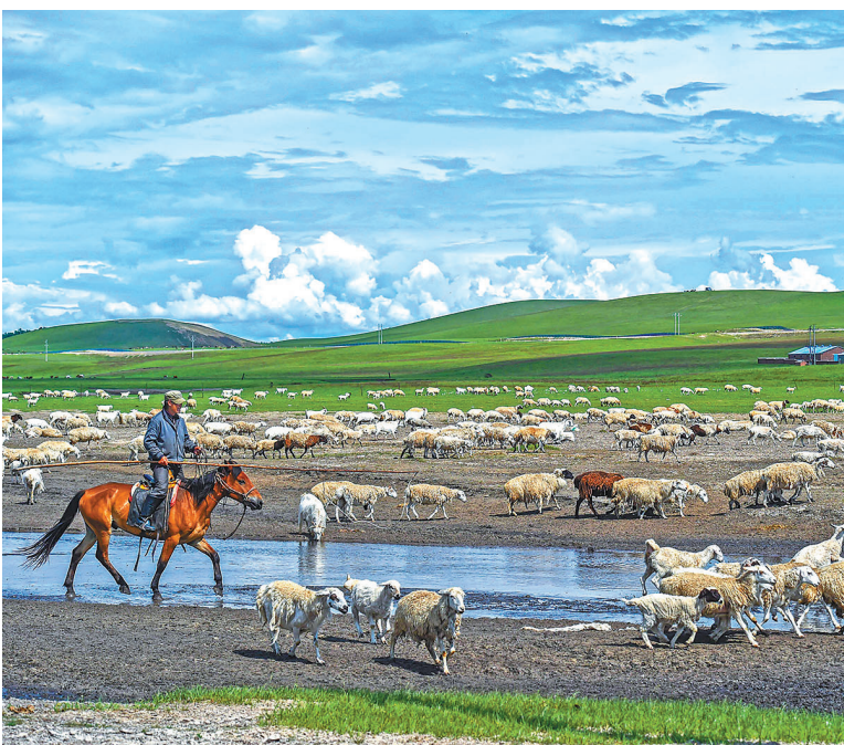
6月26日,牧民在新巴尔虎左旗道乐都夏营地放牧。夏日里,位于内蒙古呼伦贝尔市新巴尔虎左旗的夏营地水草丰美、绿草如茵,迎来放牧黄金季节。

瓦店遗址发现于1979年,是河南省内的一处夏代早期都邑性遗址,先后被纳入夏商周断代工程、中华文明探源工程、考古中国夏文化研究等重大考古项目。