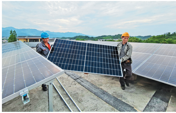
近日,松阳县委党校启动绿色学校创建,在学校落地安装屋顶分布式光伏发电项目,建成投运后每年发电量预计超4万度。