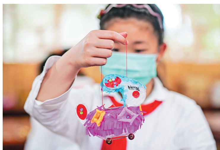
5月27日,在南京市秦淮区武定新村小学,一名学生展示兔子灯。近年来,江苏省南京市秦淮区武定新村小学围绕非遗项目秦淮灯彩,开展一系列教育实践活动,构建丰富多元的秦淮灯彩课程,实现非遗文化保护与文化教育相结合,帮助学生熟悉非遗文化,感受非遗魅力。