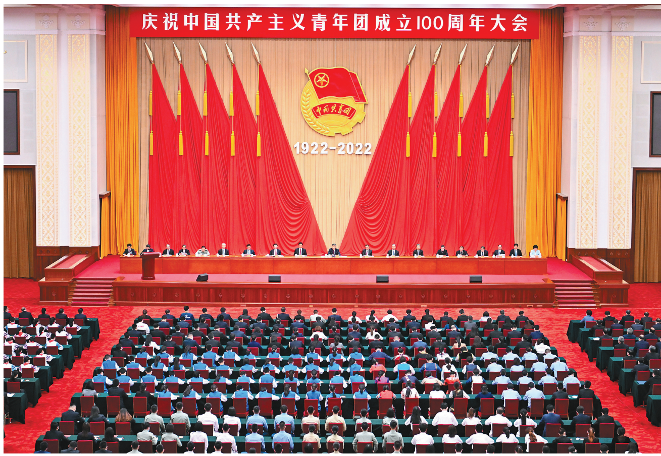
5月10日,庆祝中国共产主义青年团成立100周年大会在北京人民大会堂隆重举行。中共中央总书记、国家主席、中央军委主席习近平在大会上发表重要讲话。