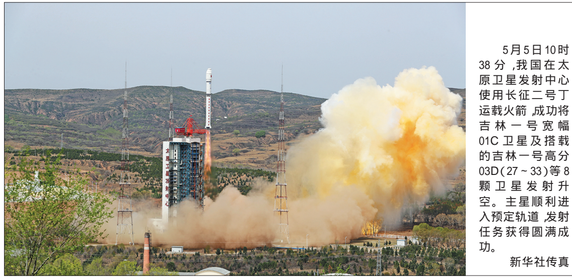
5月5日10时38分,我国在太原卫星发射中心使用长征二号丁运载火箭,成功将吉林一号宽幅01C卫星及搭载的吉林一号高分03D(27-33)等8颗卫星发射升空。主星顺利进入预定轨道,发射任务获得圆满成功。 新华社传真

下一步,国家知识产权局将举行专题研讨会,向国内外创新主体和代理机构全面介绍海牙体系,增进公众对海牙体系了解,促进国内外申请人通过海牙体系提交外观设计申请,更好保护自己的创新创意,为全球贡献更多优秀设计。