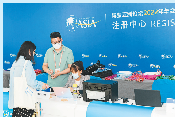
4月18日，工作人员在博鳌亚洲论坛年会注册中心工作。