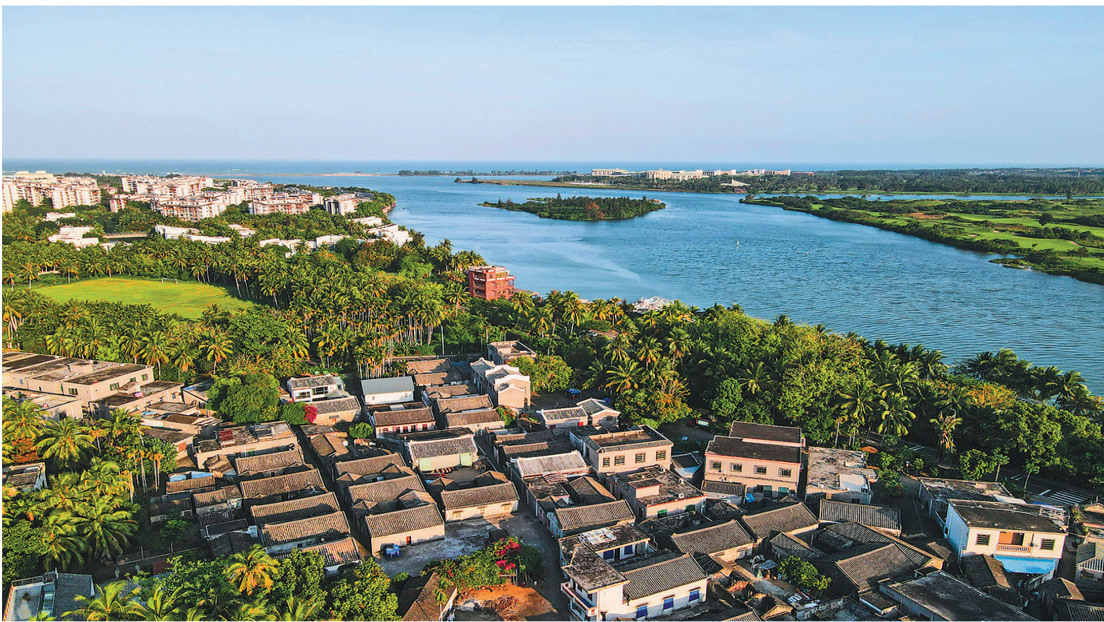
这是4月9日拍摄的博鳌镇南强村。

以“疫情与世界：共促全球发展，构建共同未来”为主题的博鳌亚洲论坛2022年年会，定于4月20日至22日在海南省博鳌镇举行。本届论坛年会将围绕国际社会最为关注的疫后世界经济复苏与可持续发展等议题，进行对话和交流，凝聚共识，贡献智慧，力图为处于十字路口的世界，谋划未来发展方式与方向。