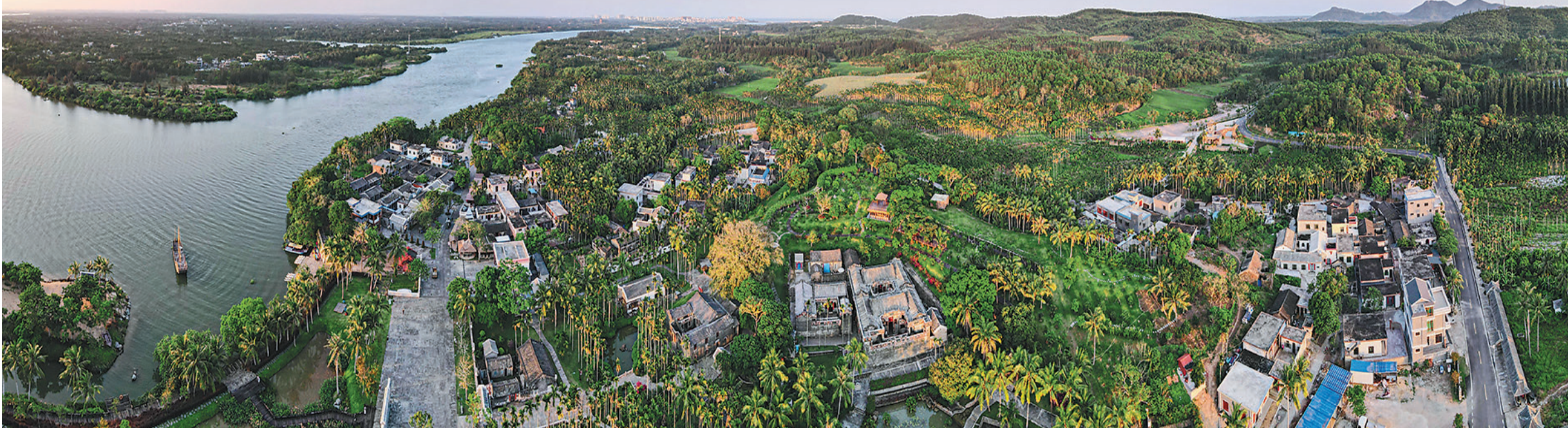
这是4月8日拍摄的博鳌镇留客村。