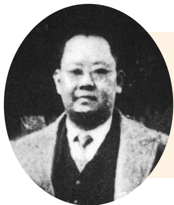
结识陈云，领导上海工人运动

1922年，章秋阳(时名为章郁庵)进入上海商务印书馆虹口发行所当营业员，与同事陈云(时名廖程云，无产阶级革命家、政治家，杰出的马克思主义者，中国社会主义经济建设的开创者和奠基人之一)成为好友，并深受陈云的革命思想影响。在1925年左右，恽雨棠、陈云、章秋阳、徐新之、薛兆圣先后加入了中国共产党，隶属上海商务印书馆编译所党支部，支部书记是董亦湘，后由沈雁冰(茅盾)担任。章秋阳和陈云一起在商务印书馆发行所秘密建立发行所党支部后，陈云、章秋阳、徐新之先后担任过党支部书记。关于这段历史，陈云是这样回忆的：1925年9月至1926年的前一段时间，党的支部书记是沈雁冰。那时发行所党员少，与编译所的党员合在一个支部，在沈雁冰家内开支部会时，只有章郁庵(章秋阳)和我参加。1926年后一段时间，商务发行所单独成立支部，支部书记是谁？我记得似乎是章郁庵(他兼上海店员工会主席)。