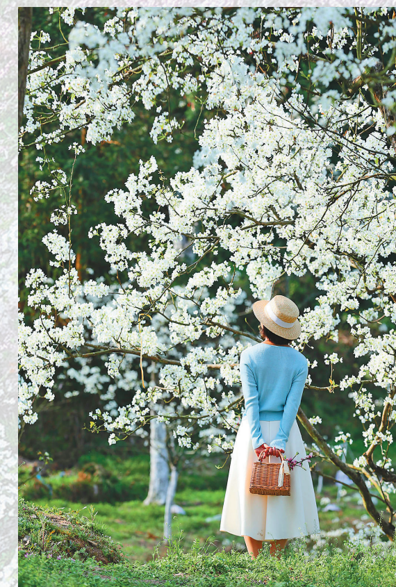
包山梨花