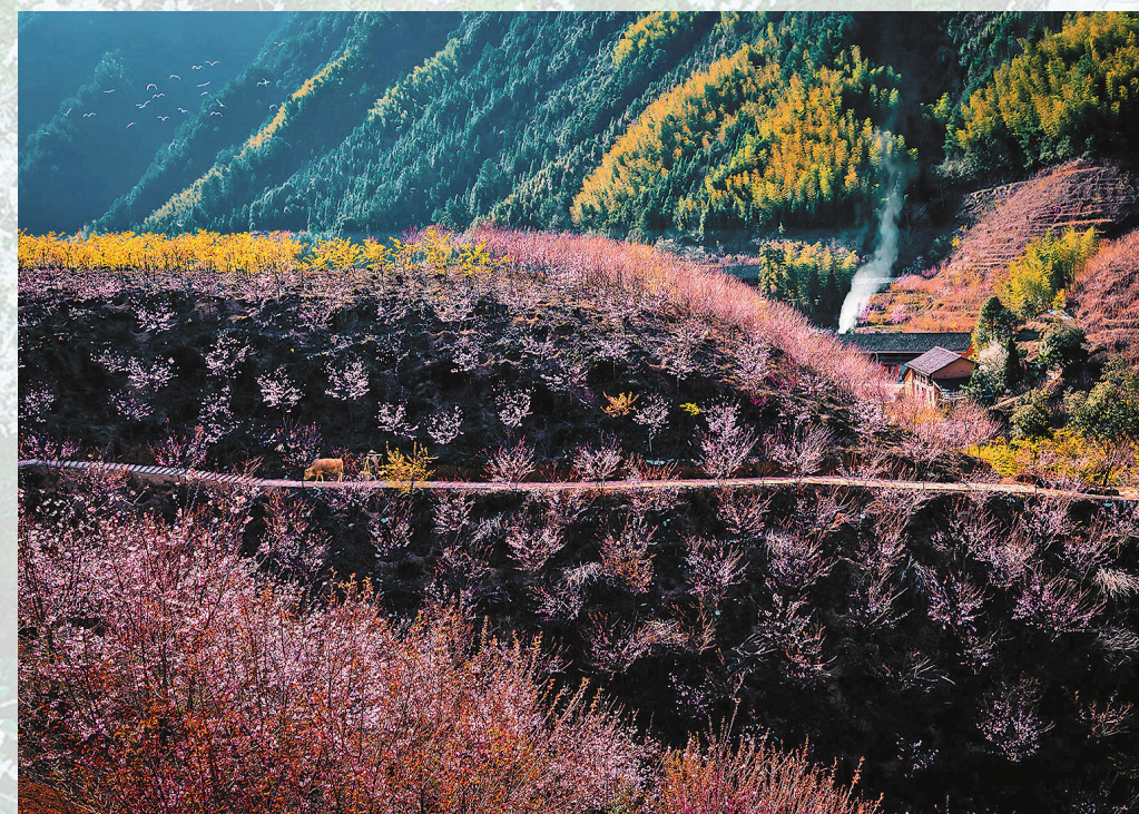
住龙樱花

据悉,2022年以来园区已接待前来参观游客2万余人次。趁着春光正好,趁着花还在开,何不怀抱美好信念,一路前行。不负春光,揽尽春色。不负春光,繁花与共。