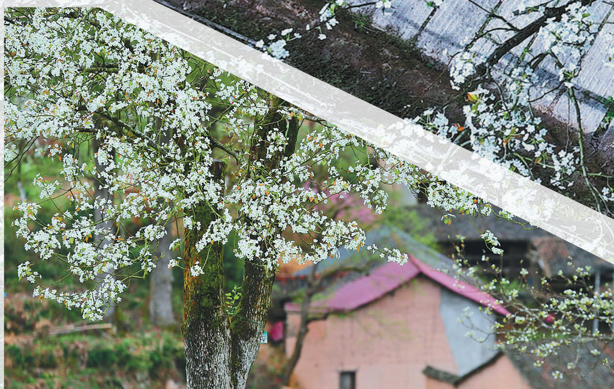
包山梨花