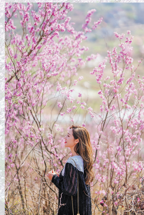
巾山紫荆花