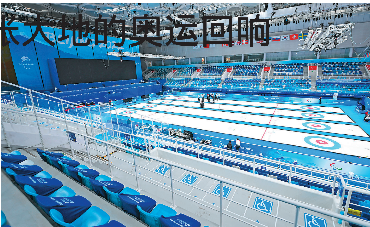
这是在国家游泳中心冰立方内拍摄的无障碍看台(2022年3月1日摄)。