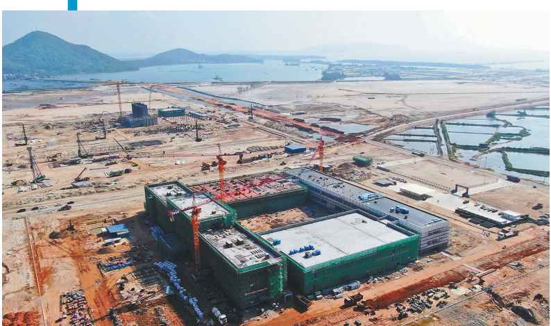
这是广东省茂名市滨海新区在建的绿色化工和氢能产业园。