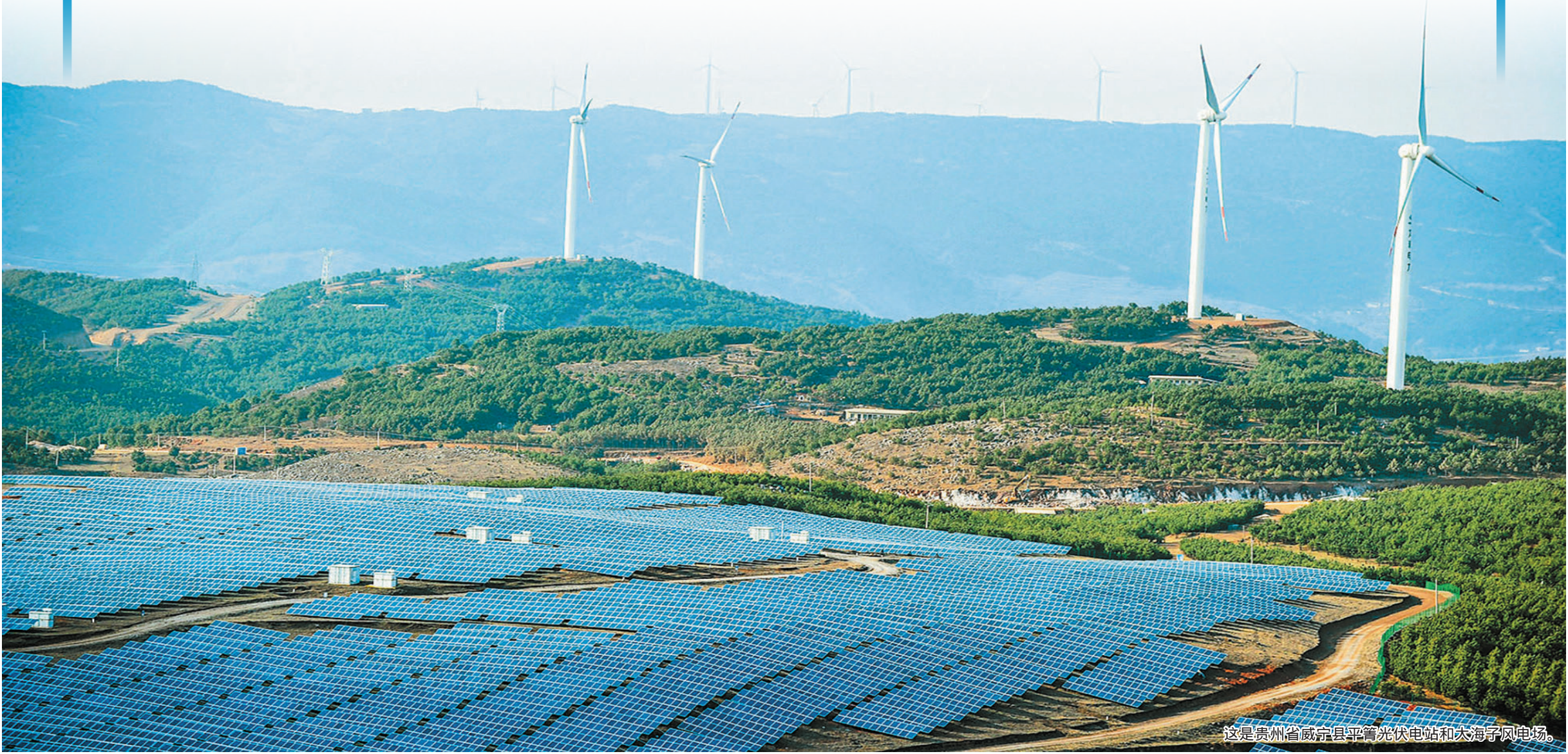
这是贵州省威宁县平箐光伏电站和大海子风电场。

新华社记者 安蓓 高敬 张辛欣 熊争艳 刘夏村 戴小河 (新华社北京3月7日电)