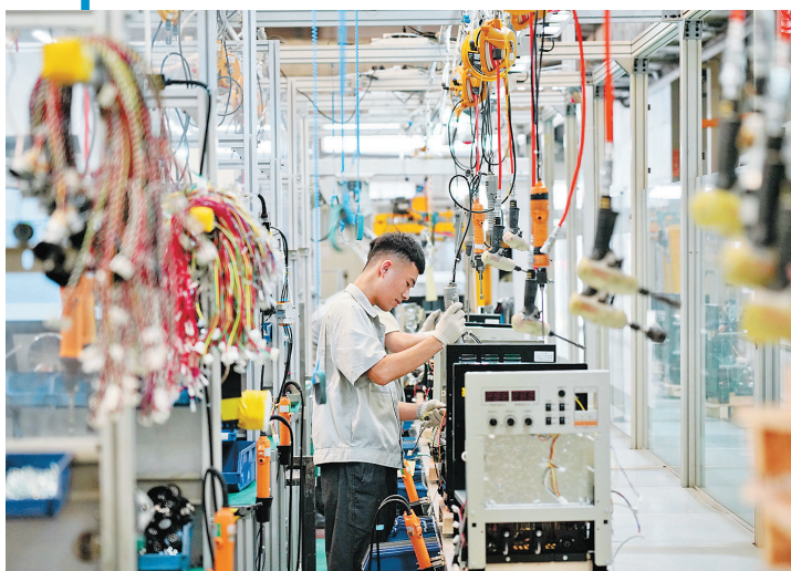
2021年7月8日,唐山松下产业机器有限公司的工人在电焊机零部件生产线上工作。