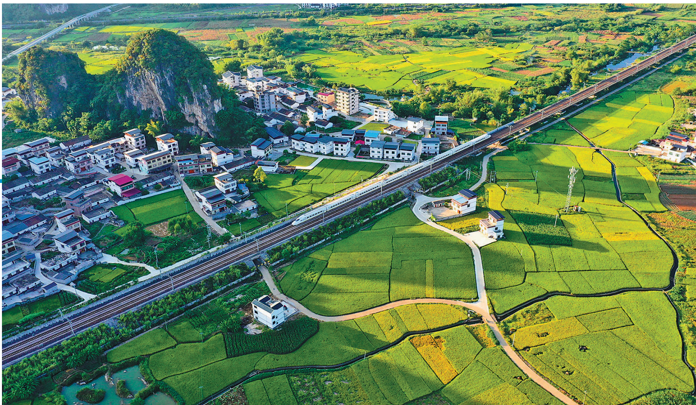
2021年9月22日,在广西柳州市柳江区,动车组列车从稻田旁驶过(无人机照片)。

越是困难越要坚定信心、越要真抓实干。一系列务实举措,释放出坚持“稳字当头、稳中求进”,努力顶住经济下行压力、推动高质量发展的鲜明信号。