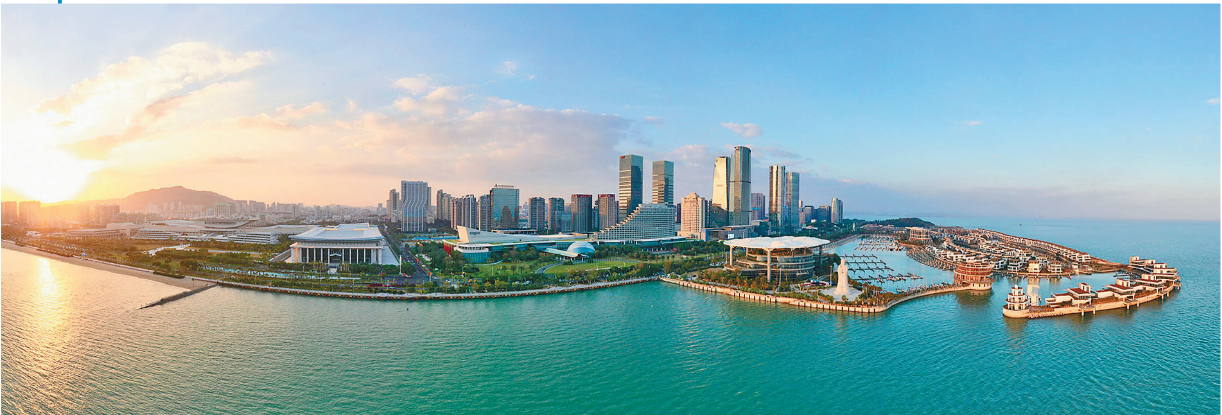
厦门国际会议展览中心、厦门国际会议中心及周边建筑群(2021年12月9日摄,无人机照片)。