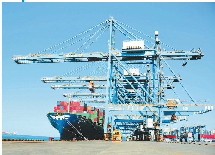
2月20日拍摄的山东港口青岛港全自动化码头作业场景。